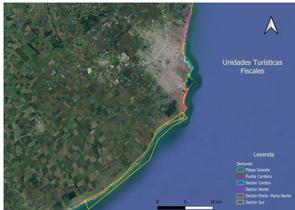
Figura 2. Unidades turísticas fiscales en el Municipio de General Pueyrredón en Argentina