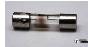
Ilustración 1. Fusible abierto

Los fusibles son elementos eléctricos de bajo costo cuyo único propósito es proteger otros elementos que se encuentran en el mismo circuito los cuales en caso de sufrir algún daño resultan más difíciles o costosos de reemplazar. Tal protección es lograda debido al derretimiento del hilo conductor interno con el que cuenta el fusible el cual tiene una resistencia al calor mucho menor que los demás conductores haciendo que el circuito se abra en ese punto logrando así que una corriente peligrosa alcance a otro elemento del sistema. Dicho calor es generado por la corriente eléctrica que circula como parte de pérdidas de energía al transferir esta de un punto al otro, entre más corriente circule mayor será el calor generado. Sin embargo, en la realidad la corriente que circula a través del fusible es variable, lo cual tiene como consecuencia ciclos de enfriamiento y calentamiento en el elemento lo que puede significar una degradación en las propiedades con el paso del tiempo modificando la respuesta original del fusible haciendo que este no sea la adecuada.