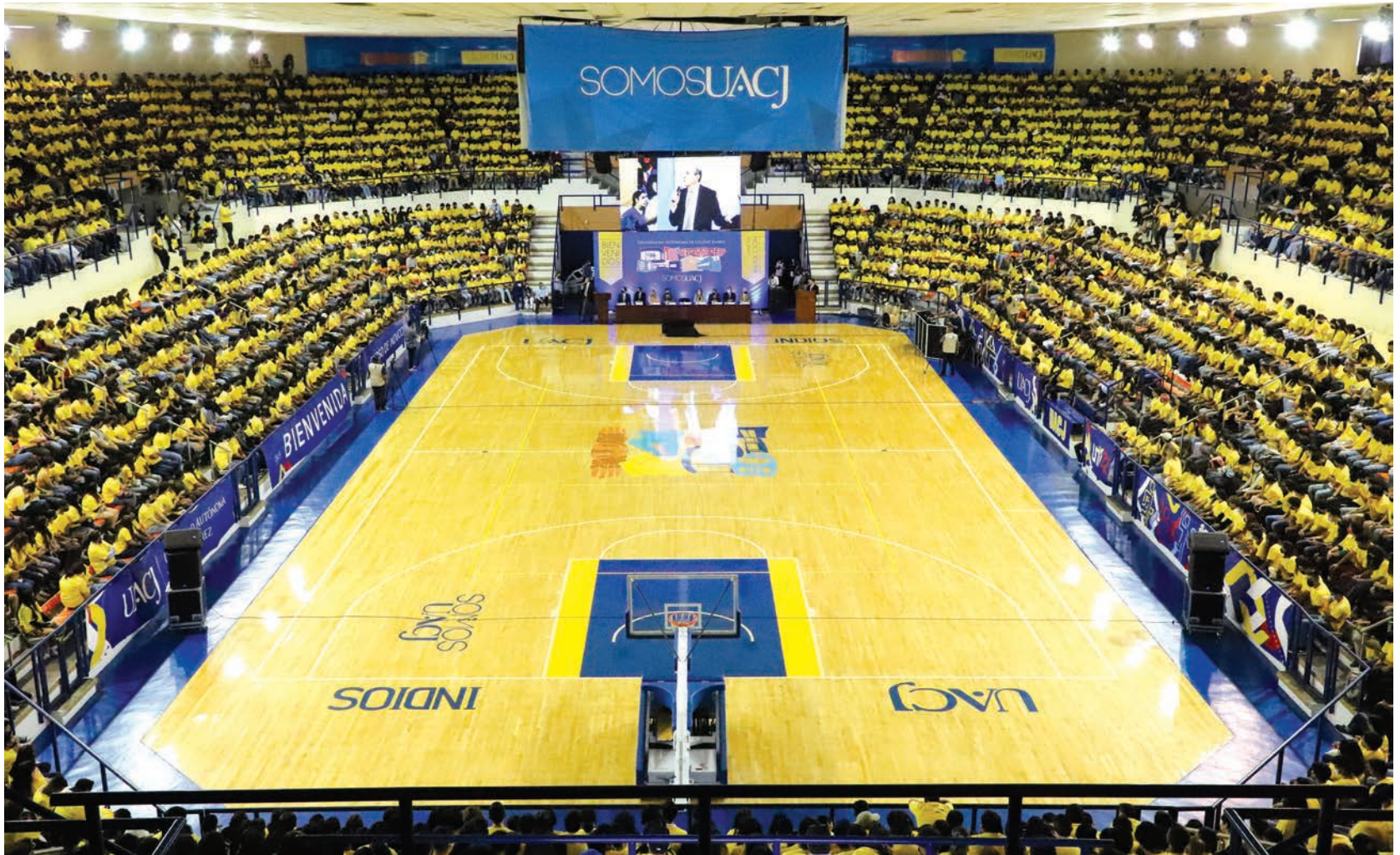
Más de cinco mil nuevos universitarios se reunieron en el Gimnasio Universitario en donde se les dio la bienvenida a la UACJ y se les impartió el curso de inducción a la Universidad.