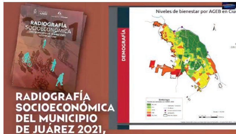
La presentación del estudio se realizó en el Instituto de Ciencias Sociales y Administración.

Dentro de los datos que contiene este documento, indicaron que Ciu-