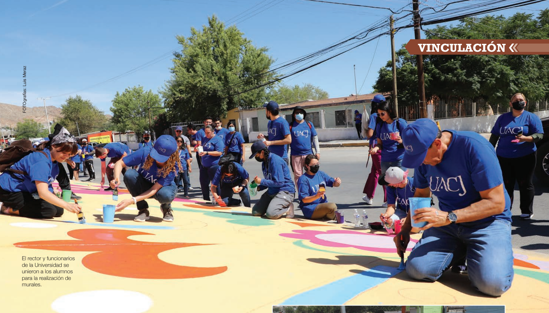
El rector y funcionarios de la Universidad se unieron a los alumnos para la realización de murales.