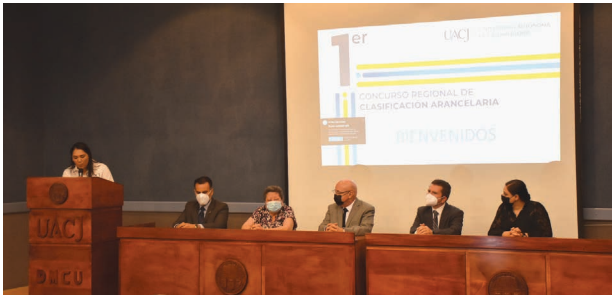
Directivos de UACJ y representantes de agencias aduanales presidieron el Primer Concurso Regional de Clasificación Arancelaria.