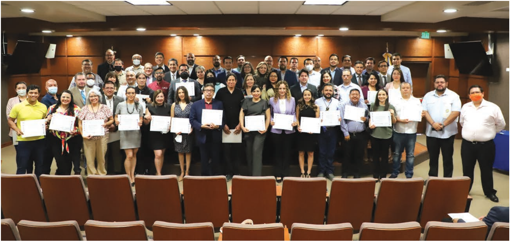
Las autoridades universitarias realizaron un evento de reconocimiento a los profesores que fueron seleccionados en la convocatoria 2021 del Sistema Nacional de Investigadores.