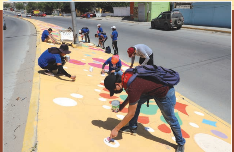
Estudiantes pintan en el camellón central del bulevar Bernardo Norzagaray.