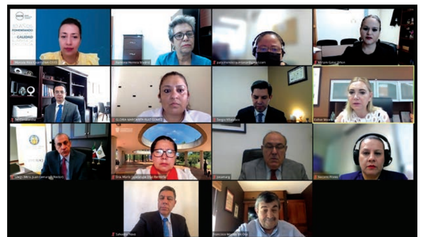
Directivos de UACJ y evaluadores de CIEES en la sesión virtual.