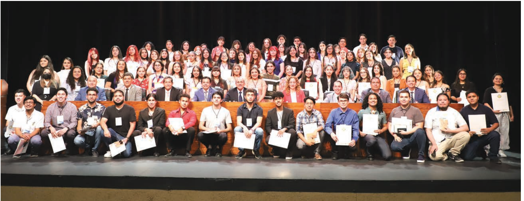
Directivos de la Universidad y los alumnos destacados.