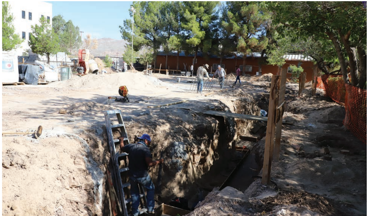
Los trabajos para la construcción de nuevo edificio se realizan en el ICOSA.