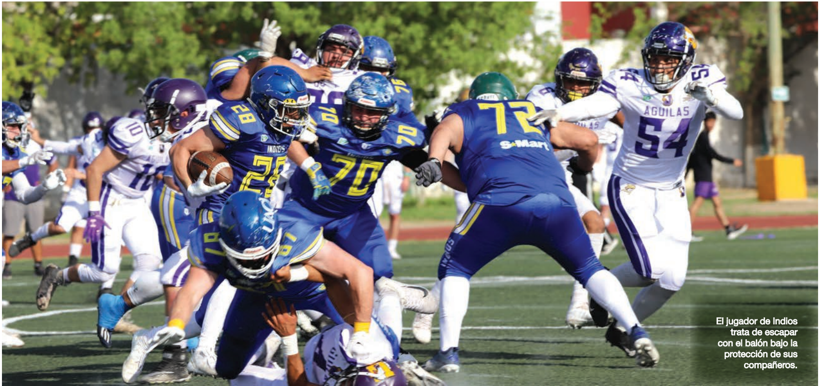
El jugador de Indios trata de escapar con el balón bajo la protección de sus compañeros.