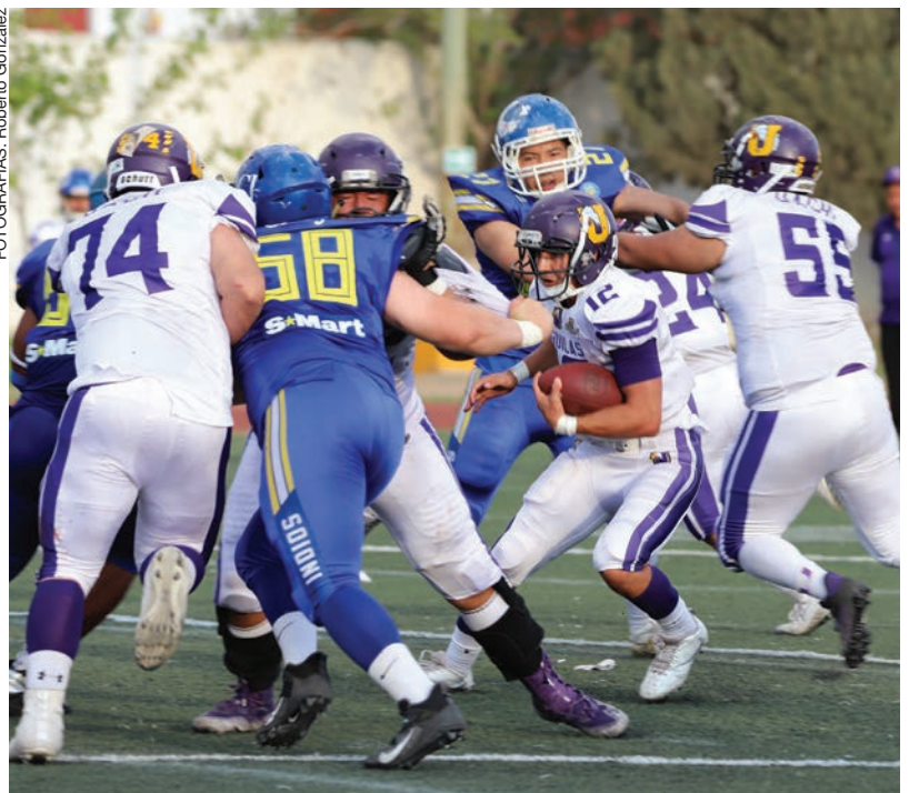
La ofensiva de las Águilas fue más eficiente en el partido disputado en el 20 de Noviembre.

Juárez (Imdej), participan equipos de la Liga Mayor de la ONEFA, ya que en anteriores ediciones se enfrentaban equipos de categoría intermedia, es decir, preparatoria. Ambas escuadras se enfrentaron por última vez en la temporada 2021 de la ONEFA; los aborígenes iniciaron con el pie derecho en la Liga Mayor tras llevarse el marcador 27-19 el pasado 30 de octubre.