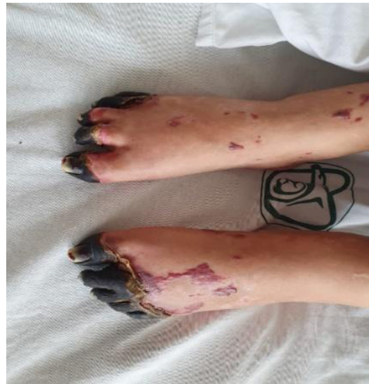
FIGURAS 3 y 4. Vista dorsal y plantar de ambos pies; se evidencia necrosis en ortejos secundaria a uso de vasopresores y lesión endotelial

El día 7 de agosto de 2019 reporta Indre PCR positiva para rickettsia. La evolución de la paciente en los siguientes días continúa favorable, lográndose en el décimo día de manejo en la UTI el cese del manejo avanzado de la vía aérea posterior a protocolo weaning , y continuando en los siguientes días con la remisión completa de la falla orgánica múltiple. Se otorga el alta dieciocho días posteriores a su ingreso, con necrosis en ortejos de ambos pies como único estigma de la estancia intrahospitalaria.