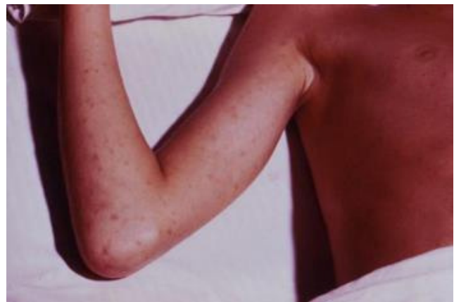
FIGURA 2. La fiebre manchada de las montañas rocosas o rickettsiosis americana, se manifiesta inicialmente como una erupción cutánea maculosa que palidece a la compresión en las palmas, muñecas, plantas y tobillos, y luego progresa en dirección proximal al cuello, cara, glúteos y tronco. Las lesiones se oscurecen y se convierten en maculopapulares, y luego se forman petequias