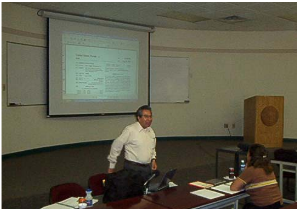
Módulo IV. Innovación tecnológica: Inventos y patentes.