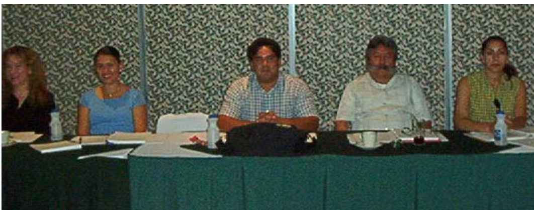
Diplomado en Investigación. Módulo I: El Arte de la Investigación