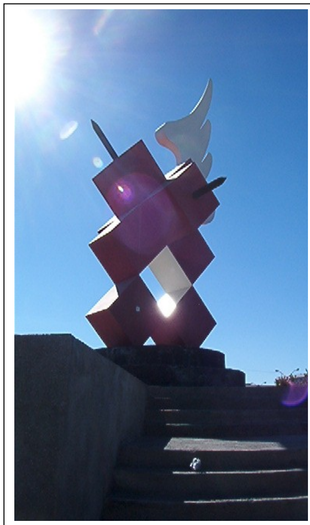
Monumento Cruz Roja. Cd. Juárez, Chih. Foto: Betina, 2004

Zuckerman, M., Lubin, B., Vogel, L., & Valerius, E. 1964. Measurement of experimentally induced affects . Journal of Consulting Psychology, 28, 418-425.