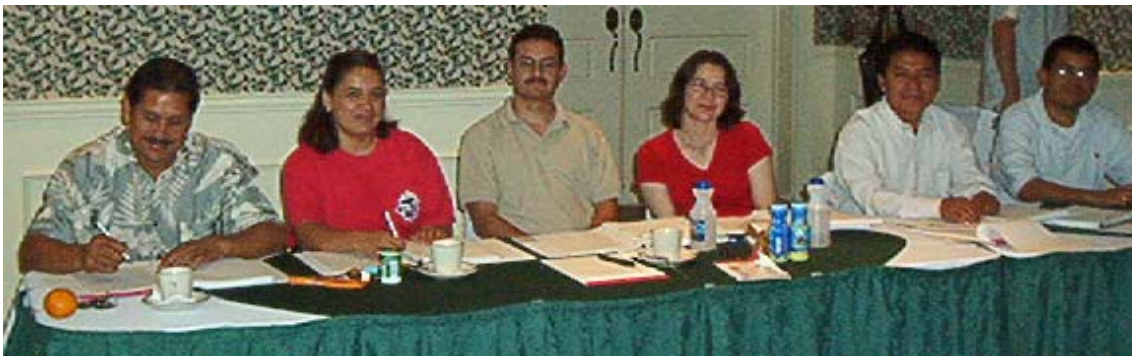
Diplomado en Investigación. Módulo I: El Arte de la Investigación. Mayo 31, 2004.