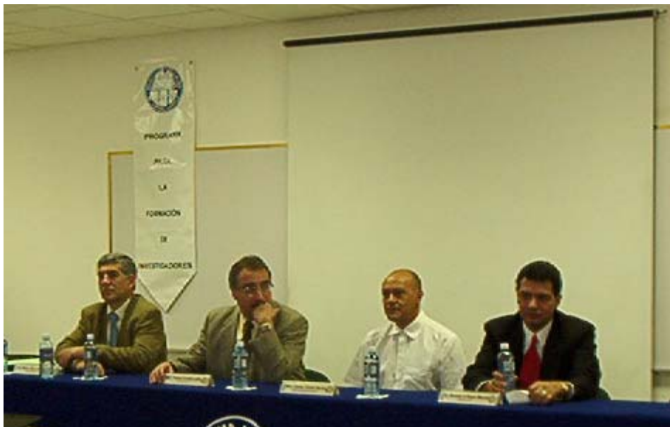
Inauguración del Programa para la Formación de Investigadores. Abril 22, 2004.