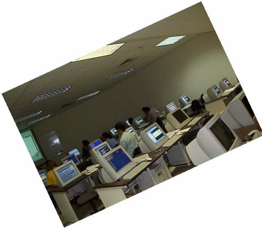
Diplomado en Investigación. Módulo III. Métodos Cuantitativos. Junio 15, 2004.