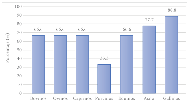
Figura 2. Porcentajes de riesgo por grupo animal.

Los animales impactados con ocho factores de riesgos considerados como severos fueron las gallinas, con 88.8% (Figura 2); el asno, con 7 factores (77.7%); los bovinos, ovinos, caprinos y equinos, con 6 factores (66.6%), y los porcinos con 3 factores (33.3%).