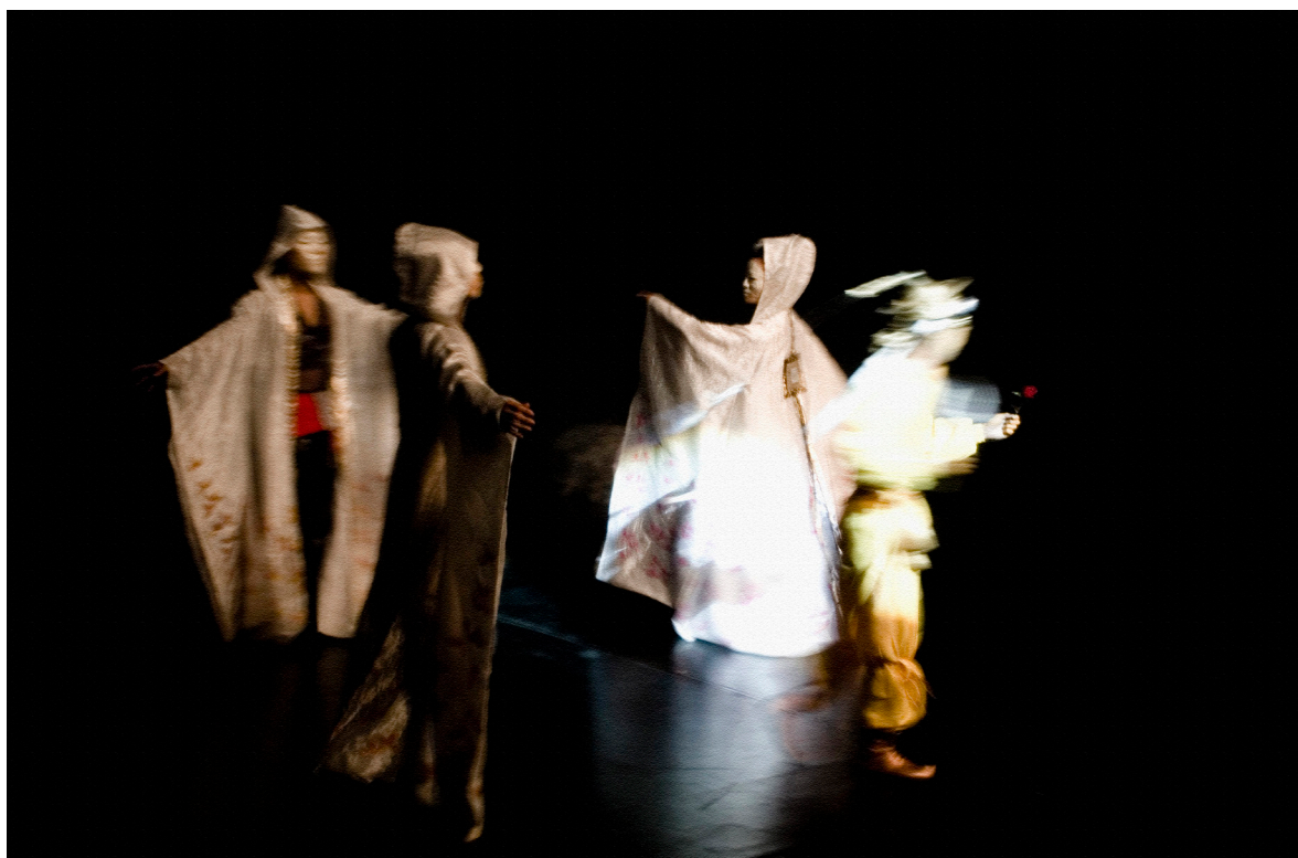
Luis Pegut, Mujer de manto efímero .

Quizá sea esta la forma de conocer a la que debiéramos aspirar en nuestro andar contemporáneo que, de manera apresurada, siempre nos dirige a un entendimiento fragmentario e inmediato. Si bien, existe una cantidad importante de autores y estudios que se vuelcan sobre el asunto aquí planteado, y que por ahora solo puedo abordar de manera esbozada, considero que el esfuerzo por concebir a Sor Juana como una pensadora integral todavía no se agota. Es necesario enunciarla muchas veces aún como la primera filósofa de México y de Latinoamérica.