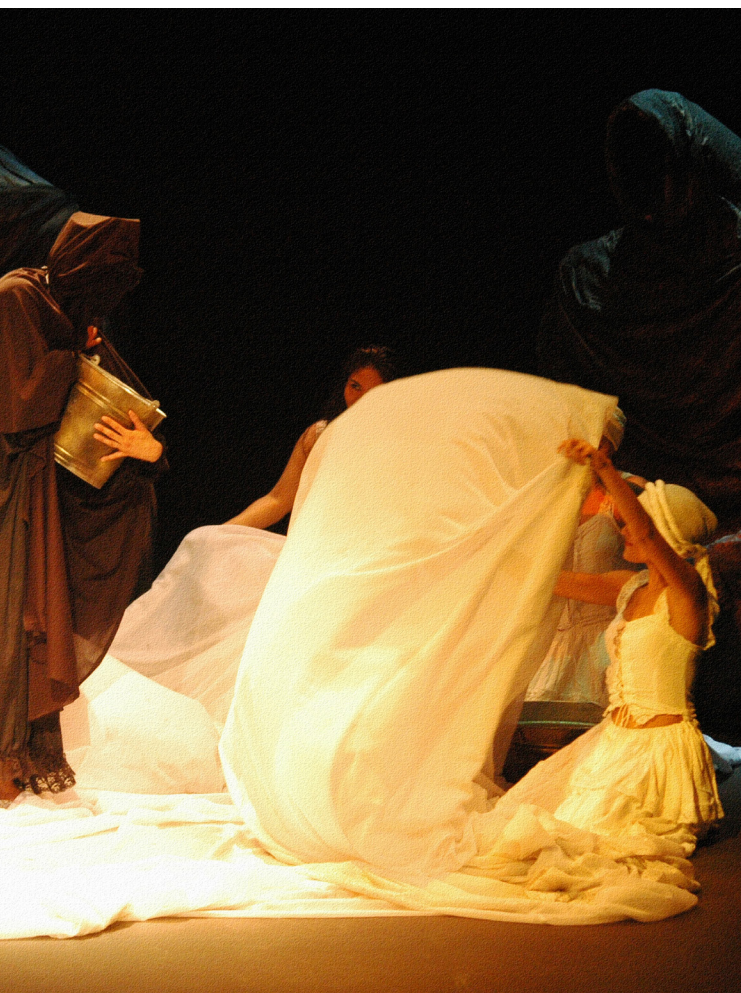
Luis Pegut , Las lavanderas de Blanco Gil .

les y se implementó la depuración del cuerpo policial local, descartando a elementos vinculados con actos de corrupción, también se instalaron cámaras de vigilancia y se actualizaron los protocolos de intervención para atender situaciones de emergencia.