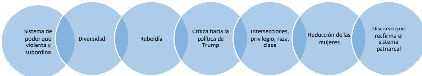
Figura 2. Otros significados al analizar los tropos en el discurso de Megan Rapinoe

El nombre que se le da al encabezado también tiene un impacto en el público, es decir, en el receptor. En este título se apela a las emociones, a la solidaridad, la fuerza, la unión de un equipo. Hablar de las emociones es de nuevo estereotipar a las mujeres, claro que son importantes las emociones,