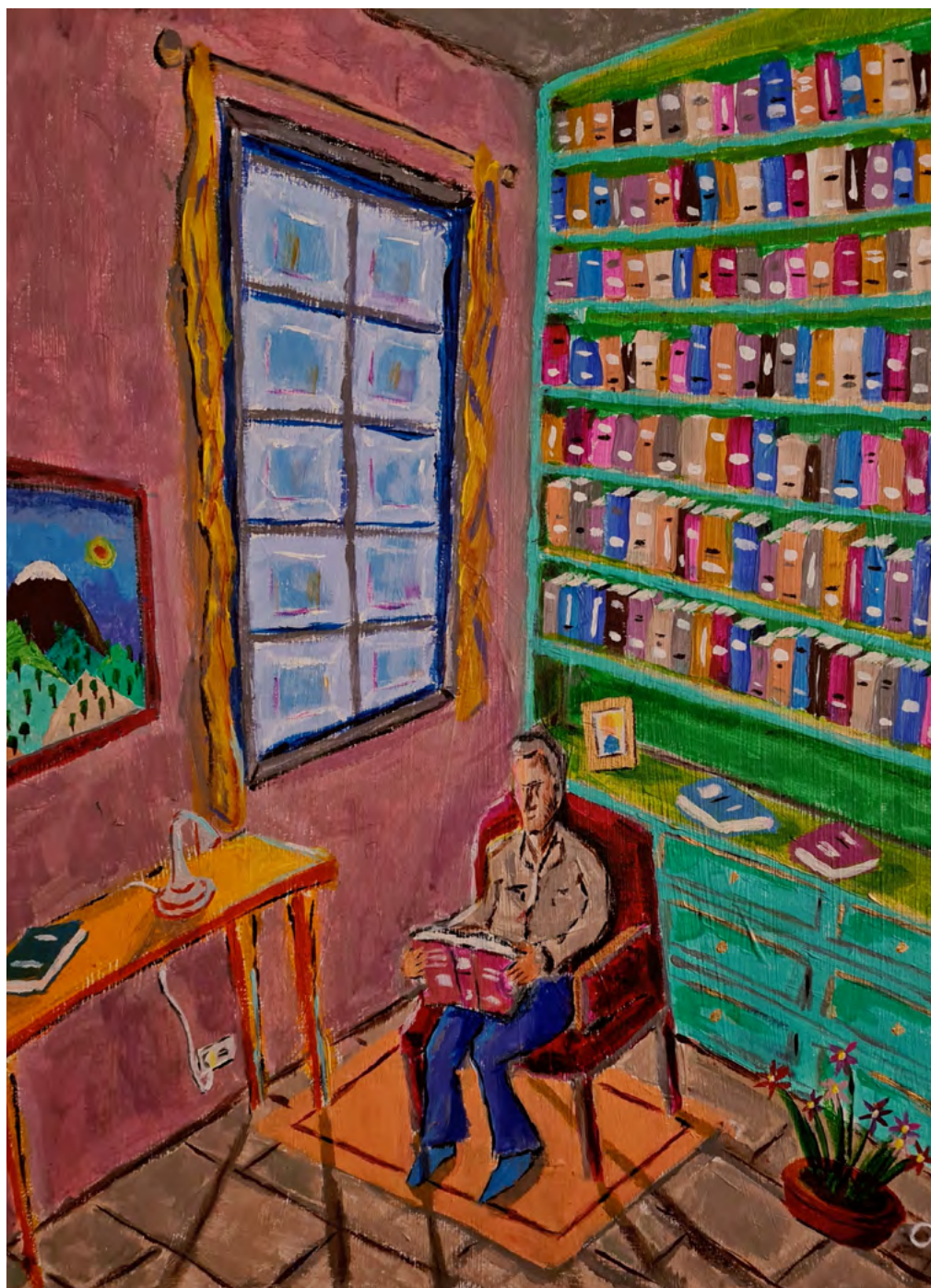
Luis E. Gutiérrez Casas: "El lector del libro rosa". Acrílico sobre lienzo. 2021.