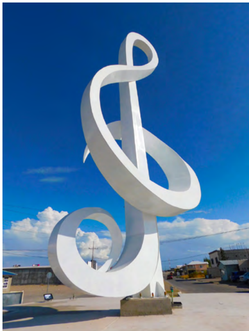
Miguel Valverde. Clave de sol, 2019.