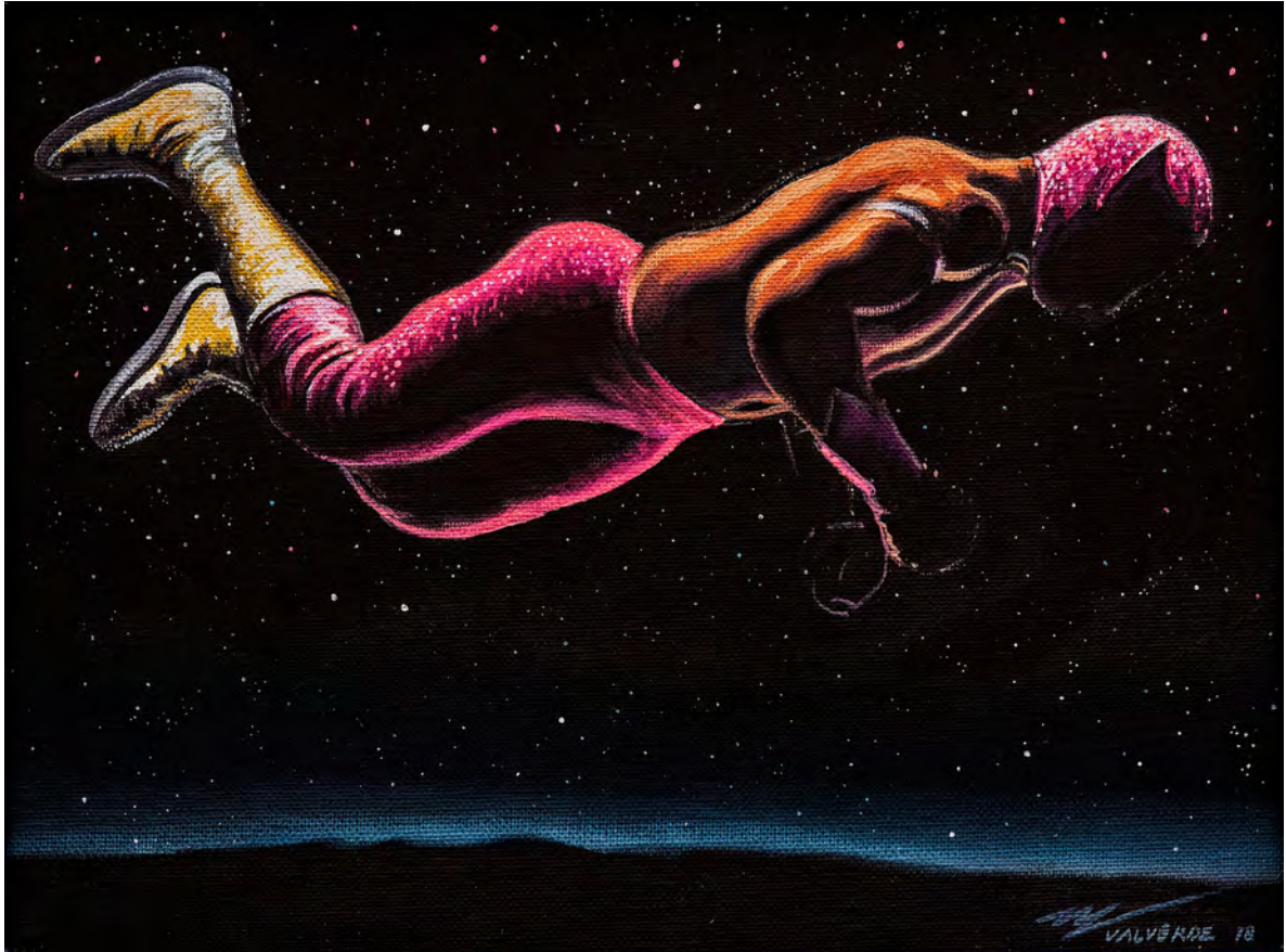
Miguel Valverde: "Volando el muro", 2018.