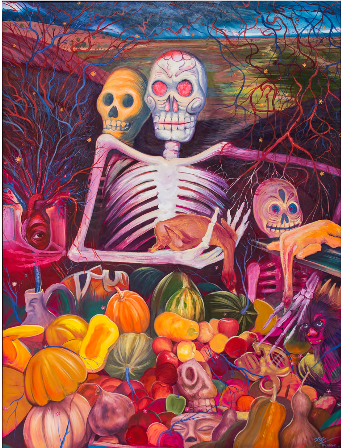
Miguel Valverde: "Mercado México", 2017.