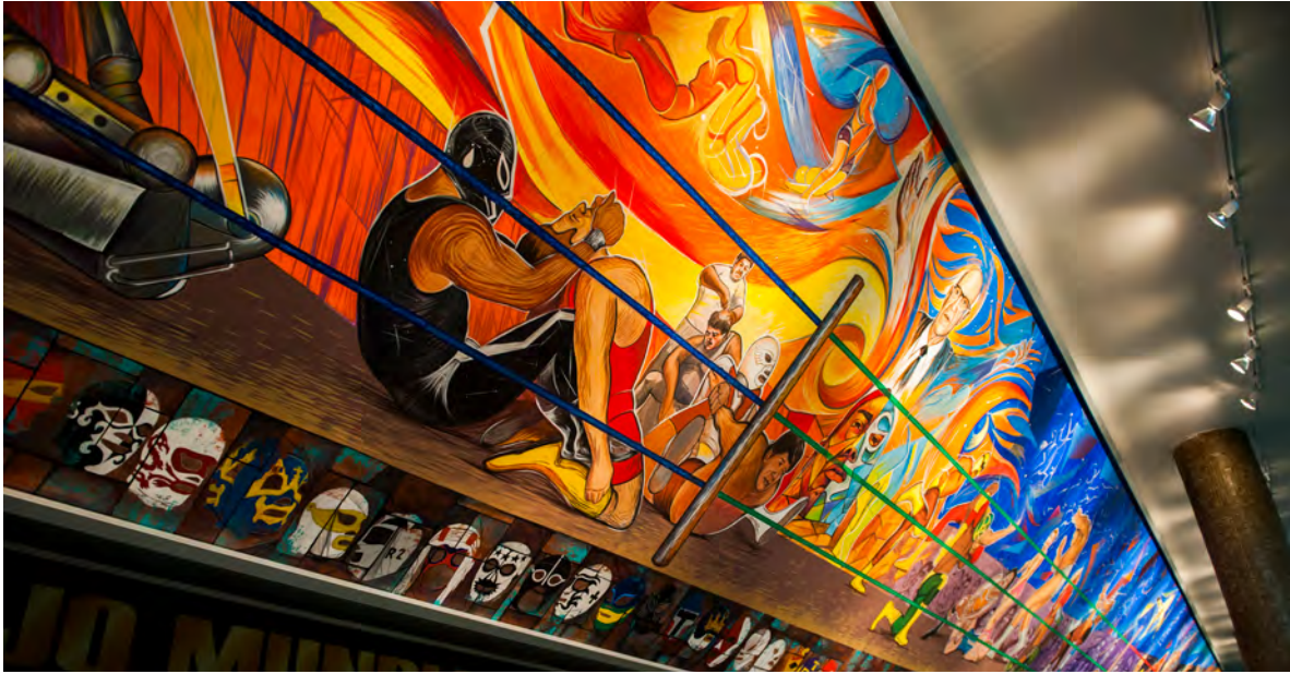
Miguel Valverde: "Mural A dos de tres caídas, sin límite de tiempo", 2013.