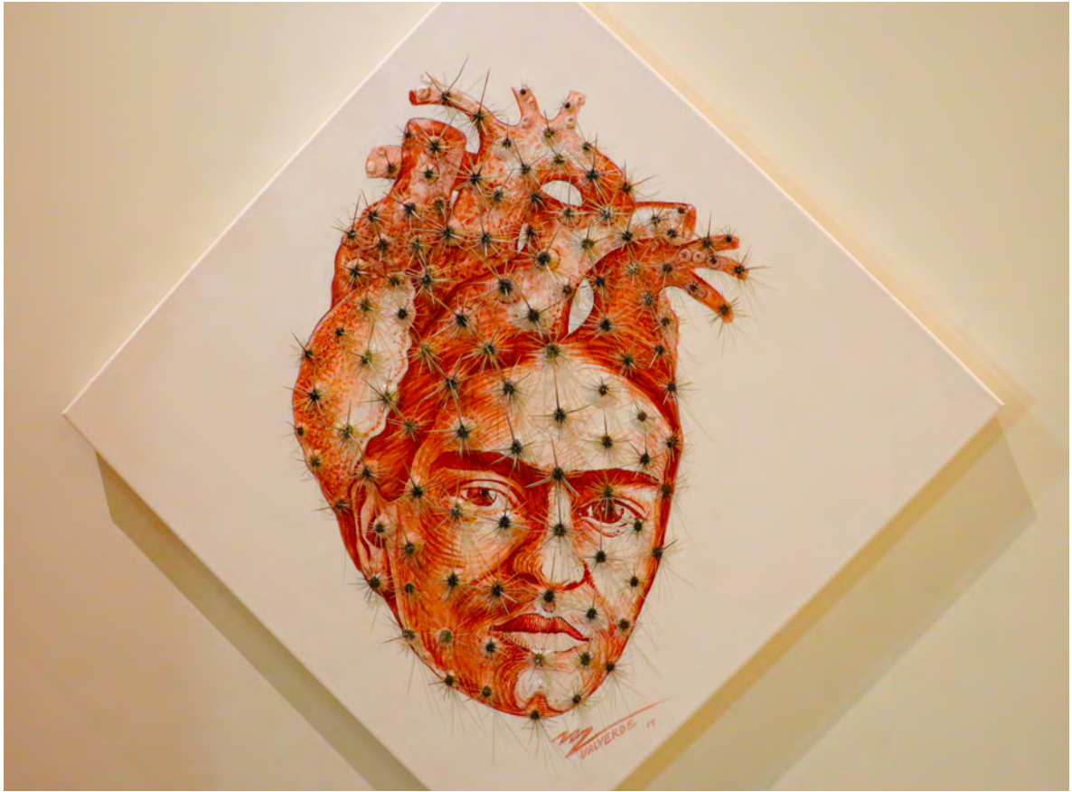
Miguel Valverde: "Mirada punzante", 2019.