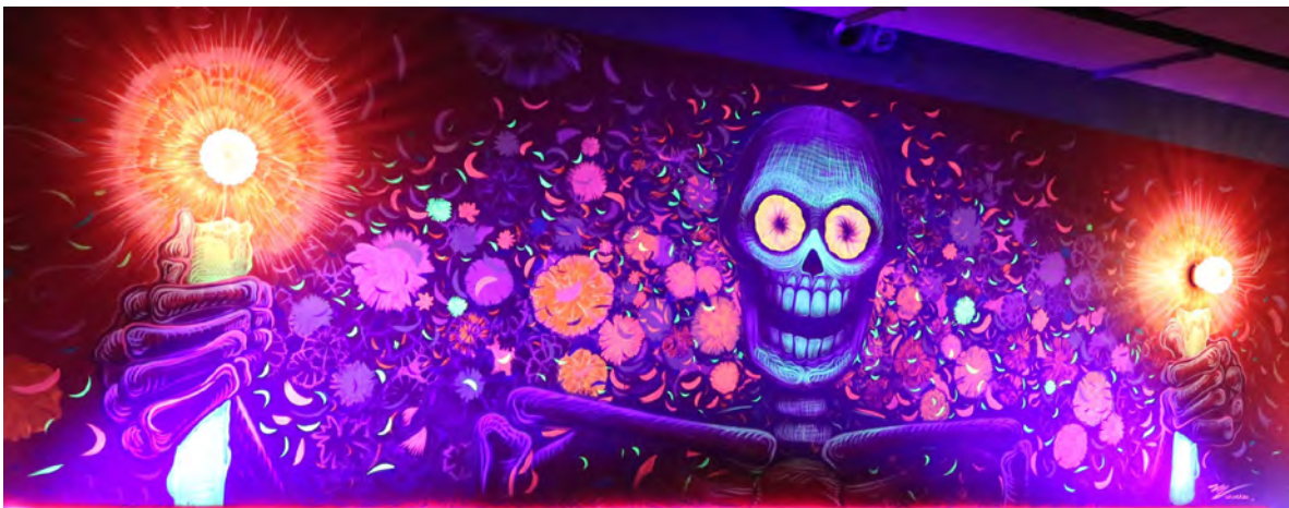
Miguel Valverde: "Café Méndez", 2017.