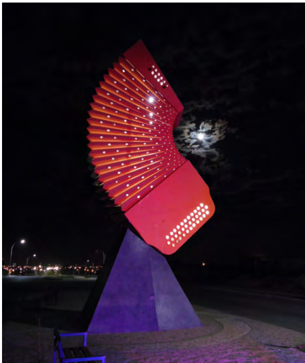
Miguel Valverde: "Acordeón", 2020.