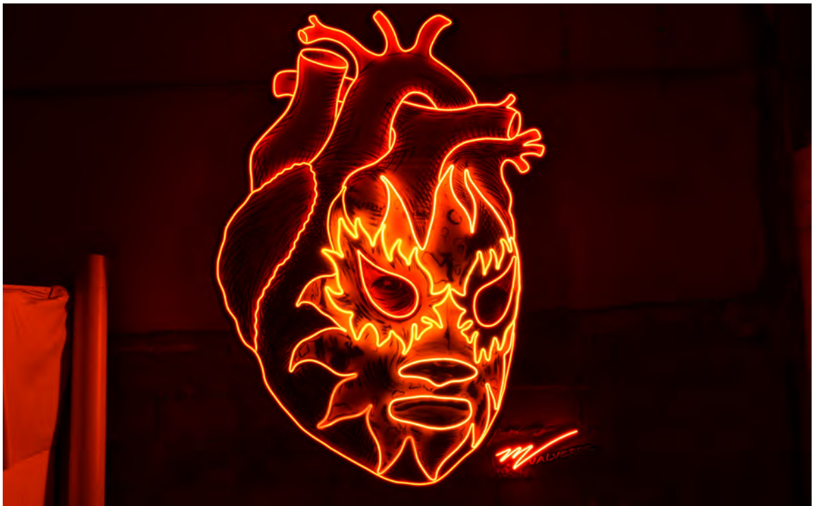
Miguel Valverde: "Corazón Solar", 2020.