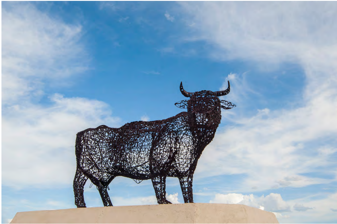
Miguel Valverde: "Escultura Cuna de la ganadería", 2015.