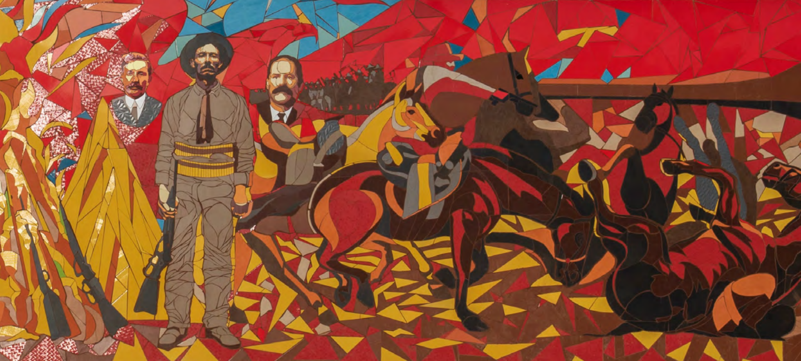
Miguel Valverde: "Una sola llama", 2022, (detalle).