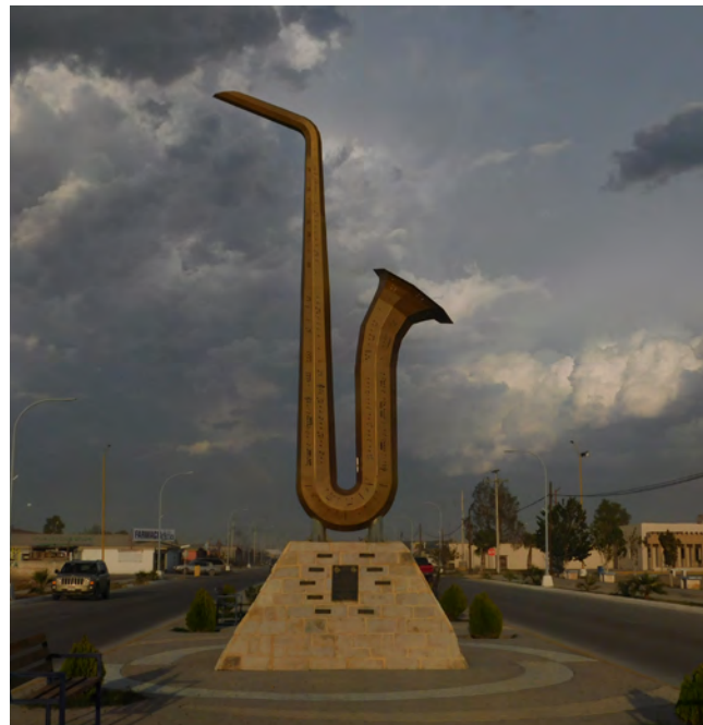
Miguel Valverde: "Música estelar", 2018.