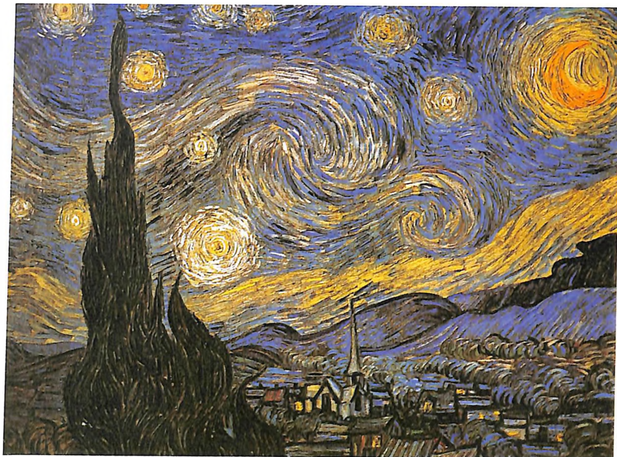
La noche estrellada (Cipreses y pueblo) (1889). Óleo sobre lienzo, 73.7 x 92.10 cm.

La obra del pintor holandés impresionista transforma la percepción de lo representado en el lienzo y las múltiples posibilidades de interpretación por parte de los espectadores de sus discursos gráficos en el siglo XX y los inicios del XXI. El dialogismo, en los términos de Mijael Bajtin es, quizá, la máxima contribución de Van Gogh a la humanidad.