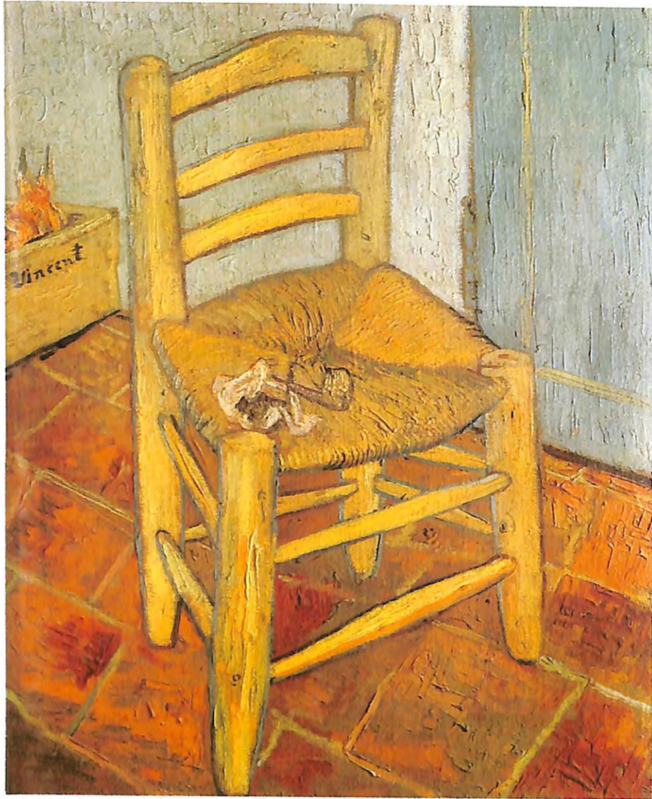
La silla y la pipa (1888). Óleo sobre lienzo, 92.5 x 73.5 cm.