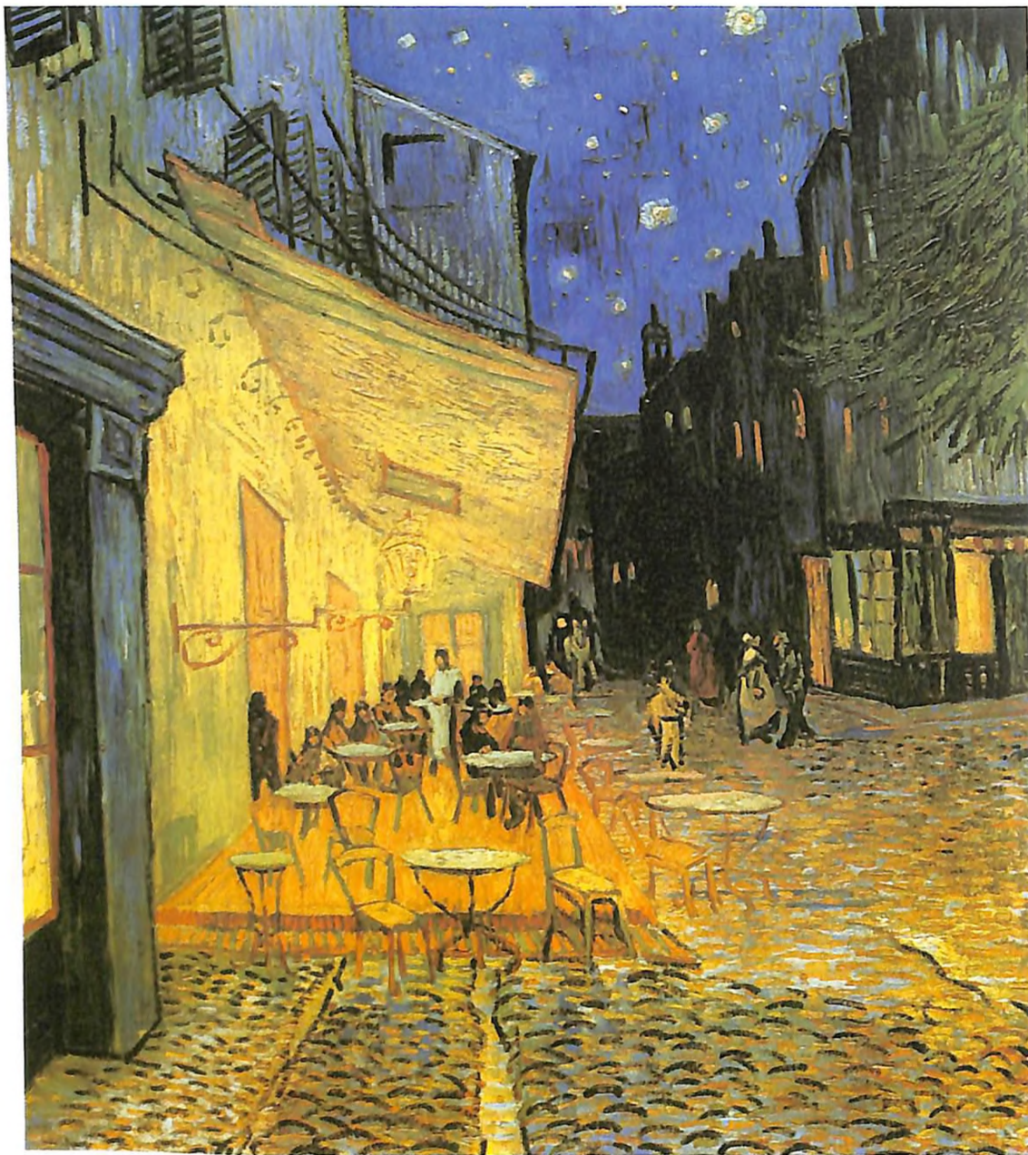
Café de noche (1888). Óleo sobre lienzo, 81 x 71.5 cm.