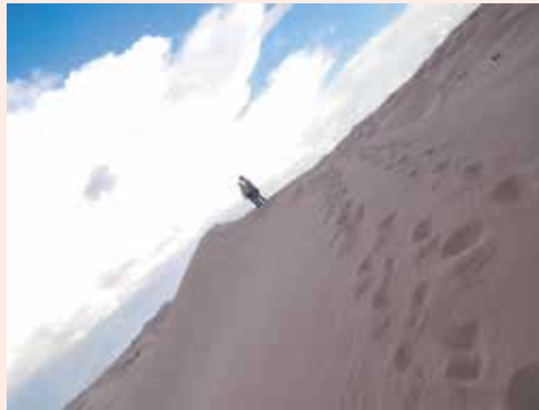
Imagen 4.3. Desierto chihuahuense, dunas de Samalayuca

¡Otro intento! Parece inútil la esperanza, ante la nueva empresa. ¿Comprendo o no comprendo? ¡Todo lo posible es ficción! Se construye, se camina por el rumbo de la utopía. Lo imposible es ficticio. Su falsedad paraliza, acorrala, atemoriza.