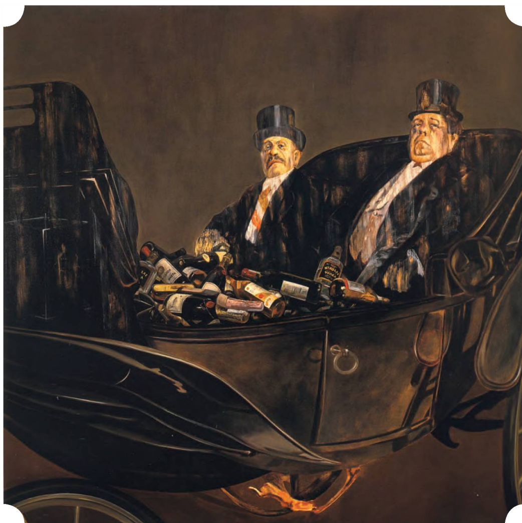
Victoriano Huerta presidente , detalle, Enrique Estrada.