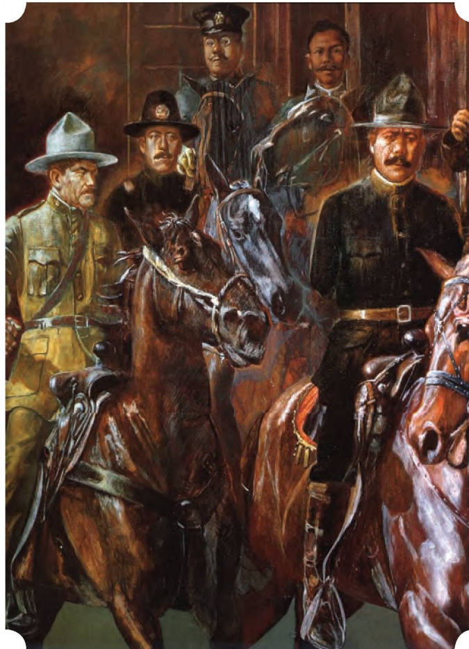
Mural Historia de Sonora muro norte (la caballada gorda) Palacio de Gobierno de Sonora Hermosillo, detalle, Enrique Estrada

Enrique Estrada recupera y recrea con singular mirada irónica los símbolos del poder y su manifestación en la época contemporánea, al tiempo que busca la armonía entre el pasado y el presente de la expresión artística.