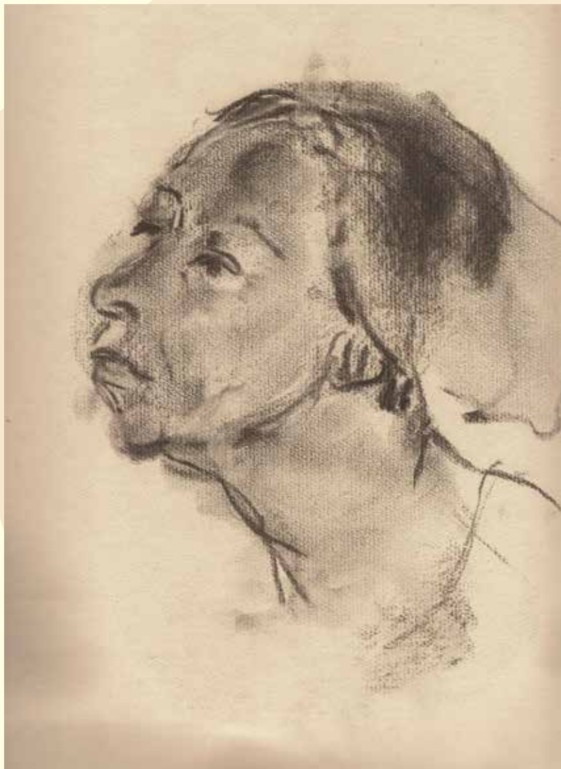
Sin título. Dibujo en carboncillo Ubicación: Casa-estudio "CUI".