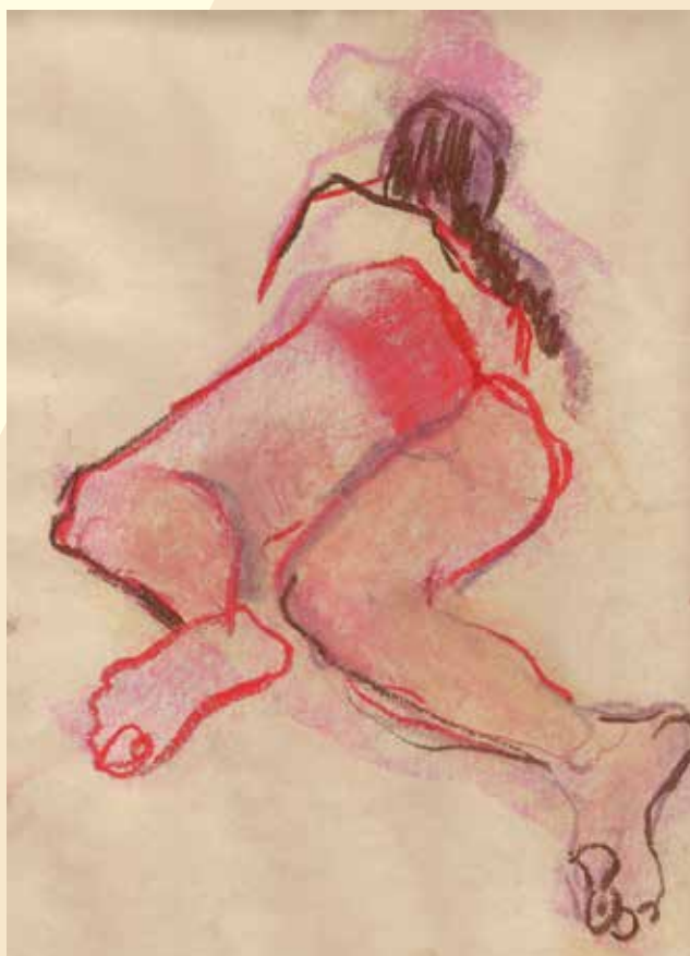
Sin título. Dibujo al pastel. Ubicación: Casa-estudio "CUI"

prepare para enfrentar el contexto específico en el que se desempeñará el interventor (política, religión y tradiciones). Este contexto se debe tomar en cuenta al momento de diseñar las IS, junto con las condiciones de inseguridad y las limitantes de acción que implica la actividad delictiva en la región. Es importante señalar que, en estos puntos sobre la relación con la realidad, así como en aspectos de formación especializada para la intervención, el estado de Veracruz tuvo una percepción más baja que la de Chihuahua; aunque esto se invirtió en la percepción de los participantes sobre las habilidades interpersonales de los interventores.