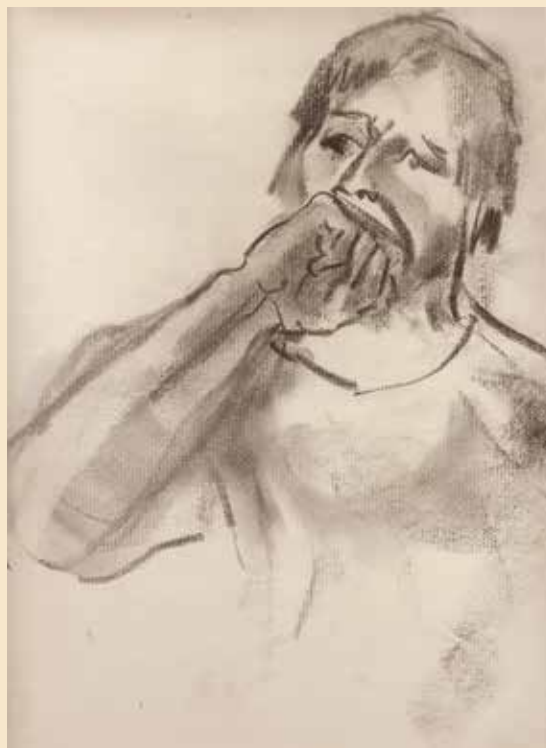
Sin título. Dibujo en carboncillo Ubicación: Casa-estudio “CUI”.

Para el análisis de la información obtenida se siguió el método cualitativo para la recolección de datos a través de la entrevista semiestructurada; tal recolección fue transversal y con un fin descriptivo. Después de analizar las percepciones de los participantes, se procedió a la conceptualización y se categorizó de acuerdo a sus contenidos para contrastar las experiencias, visiones y conocimientos sobre la intervención