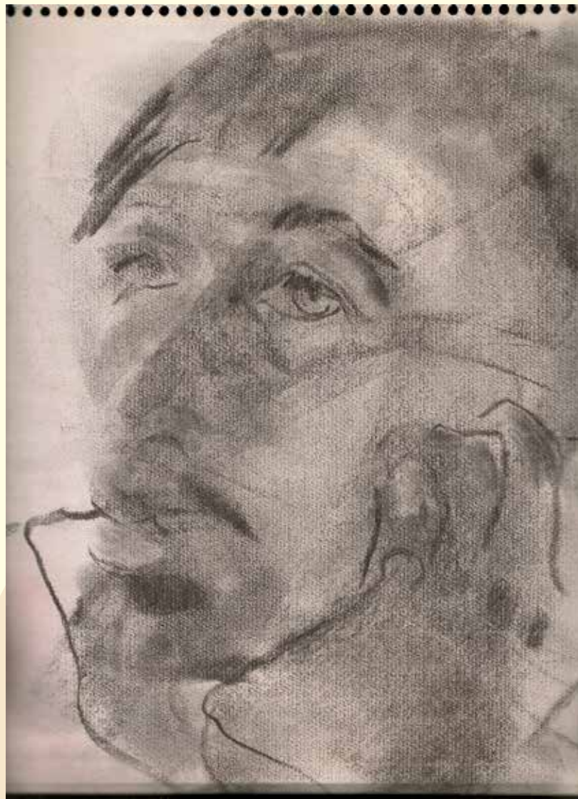
Sin título. Dibujo en carboncillo Ubicación: Casa-estudio "CUI".

educativa. Se analizaron dos IS en cada región, contando con 13 participantes, cuya caracterización aparece en la Tabla 1.