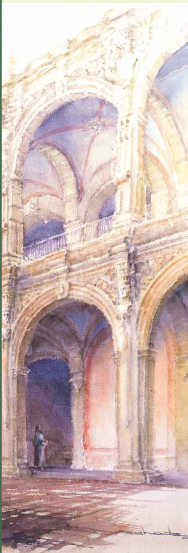
Templo y Claustro de San Agustín (detalle) / Querétaro

qué esos instrumentos, que a la vista de un “hombre civilizado” se considerarían ordinarios, pueden volver a conmovernos, porque, finalmente, cada una de las cosas que nos rodea ha sido pensada por una mente maravillosa, de modo que es necesario otra vez aprender a mirarlas. Pero el caso es que las hemos olvidado. Y con ello, hemos perdido también la posibilidad de amar abiertamente, ya no se diga a los objetos curiosos que inventa el hombre cada día, sino a los seres humanos que nos rodean. Hemos dejado de sorprendernos con la presencia del otro; nos hemos olvidado por lo tanto de nuestro compromiso con ellos para refugiarnos en nuestra propia soledad, en el pequeño universo que somos. Con ello, nos hemos concentrado ya no en la vida, sino en nuestra propia muerte.