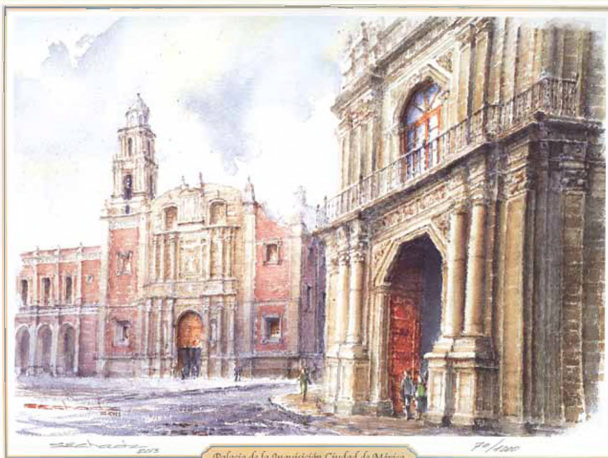
Palacio de la Inquisición, Ciudad de México

La primera vez que me acerqué a la literatura de Gabriel García Márquez fue hace muchos años; quizá tendría trece o catorce. La obra que leí entonces fue Relato de un naufrago . Recuerdo que la leí con mucho entusiasmo y creo que la terminé en una o dos tardes. En verdad, no es mucho decir, pues se trata de una narración de noventa páginas a lo sumo. Después leí otras piezas del autor colombiano, cuentos y obras llevadas al cine como El coronel no tiene quien le escriba , Crónica de una muerte anunciada , y desde luego, la cinta Eréndira , adaptación de ese larguísimo título, La terrible y triste historia de la cándida Eréndira y su abuela desalmada . Con todo, me había resistido a leer por mucho tiempo Cien años de soledad por las mismas razones que alguna vez expuso Vicente Leñero cuando explicaba, entre otras cosas, que él se había negado