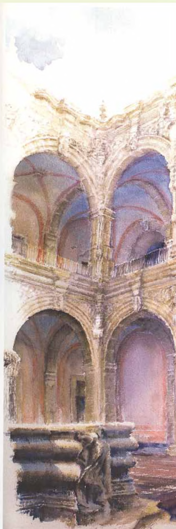
Templo y Claustro de San Agustín (detalle) / Querétaro

Cien años no sólo es una crónica familiar, es sobre todo, la crónica del olvido. La forma de maravillarse de José Arcadio Buendía con las curiosidades que cada año llegan a Macondo a manos de Melquiades, tales como el imán, el catalejo, la lupa o el hielo, expresan el olvido de nuestra propia ingenuidad, de nuestra incapacidad de sorprendernos frente a las cosas que se han vuelto comunes, pero que al mismo tiempo no dejan de ser mágicas. García Márquez nos recuerda por