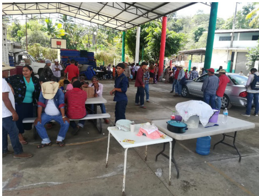
Foto 2. Llegada de los desplazados de Zihuaquío a Vallecitos de Zaragoza, Gro., enero 2020.

Comentan los desplazados de Zihuaquío que el acoso y la balacera del grupo delictivo sobre sus viviendas permaneció así hasta el mediodía. Por radio portátil pidieron ayuda a la policía estatal y al ejército para que los auxiliara y resguardara en su salida. En consecuencia, comenzaron a organizarse para salir del pueblo 3 . Tomaron únicamente algo de ropa, algunos enseres domésticos y prepararon la salida hacia la localidad de Vallecitos de Zaragoza 4 , del municipio de Zihuatanejo de Azueta. Los