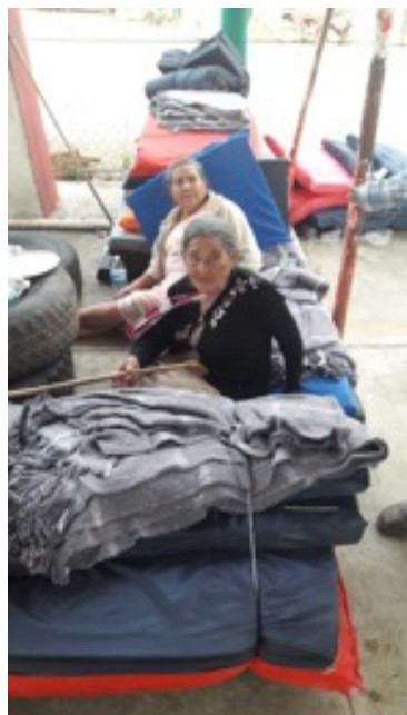
Foto 1. Llegada de los desplazados de Zihuaquío a Vallecitos de Zaragoza, Gro., enero 2020.