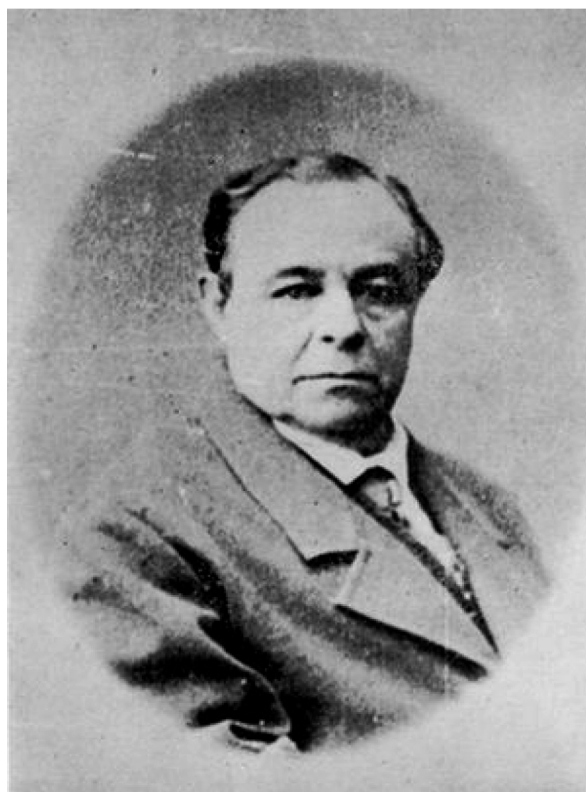
Figura 2. José Eleuterio González [1863].