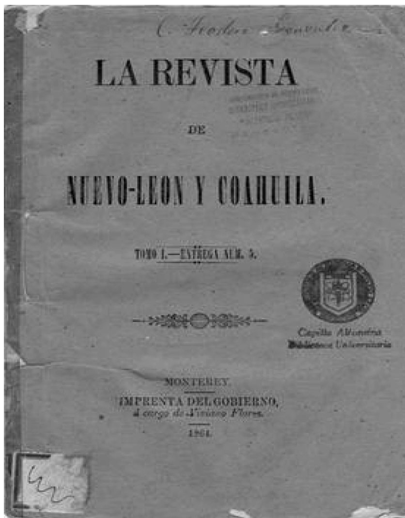
Figura 3. Portada de La Revista de Nuevo-León y Coahuila [1864].