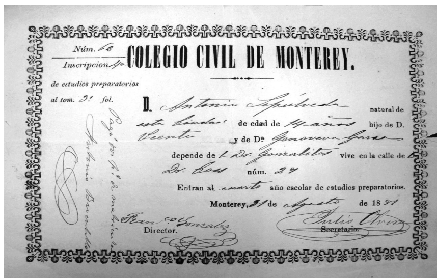
Figura 1. Boleta de inscripción de estudios preparatorios del Colegio Civil de Monterrey [1881].