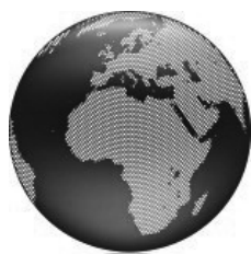
(i) fragmento territorial

Para una fragmentación con “i” fragmentos territoriales con economía cerrada: La tasa de descuento toma el valor :