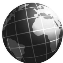
(j) = unión de varios fragmentos

Para una fragmentación con “j” fragmentos territoriales ( j < i ) con uniones de economías cerradas en otras de mayor tamaño, la fórmula sigue siendo la misma. La tasa de descuento toma el valor: