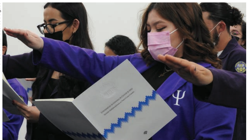
Alumnas del Programa de Psicología rinden protesta para iniciar sus prácticas profesionales.