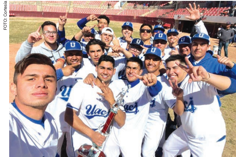
La tradicional selfie, el equipo ganador de la Liga de Beisbol Juvenil. "Gregorio Rentería Gurrola".