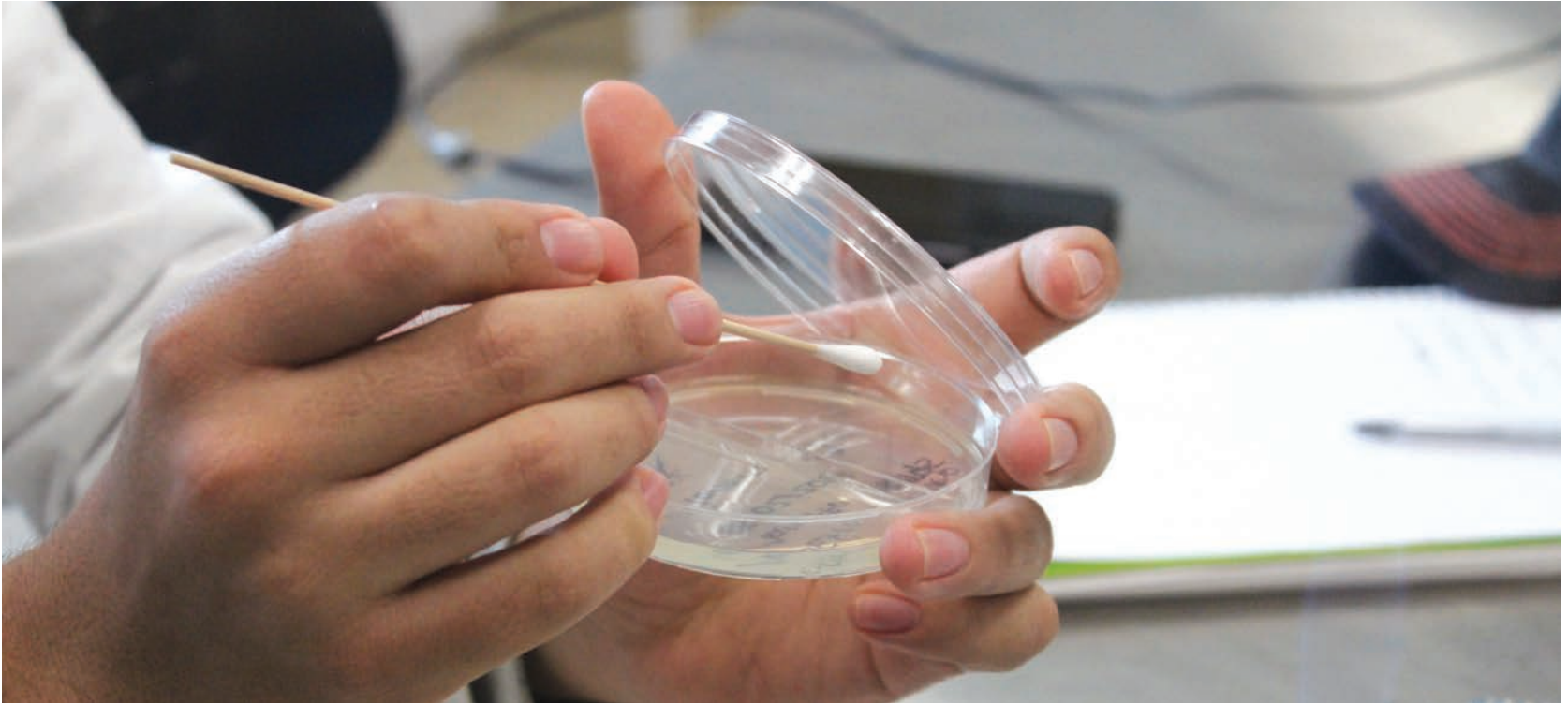
Análisis en laboratorio.