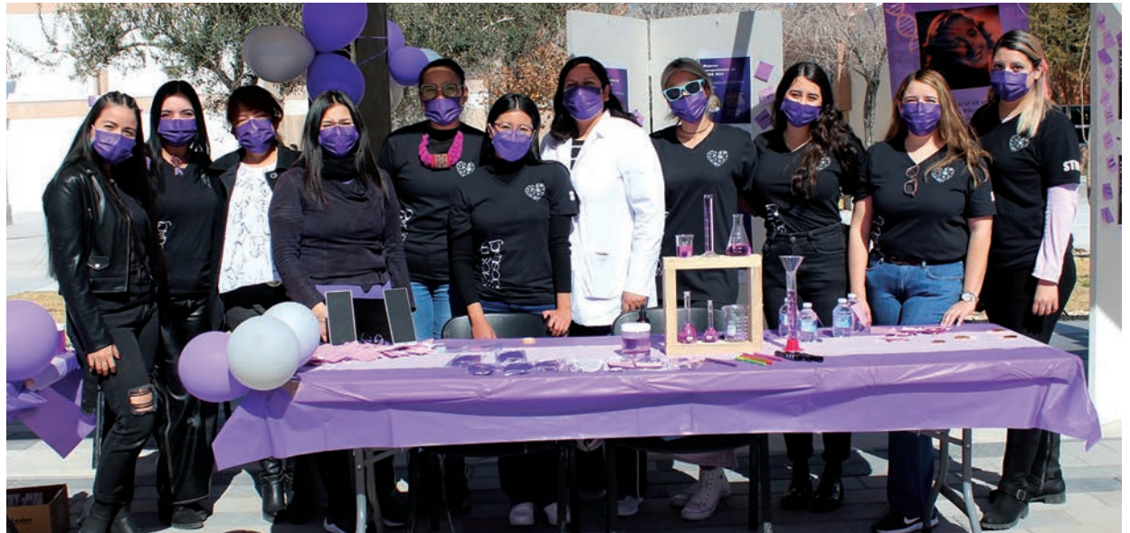
Participantes en la actividad conmemorativa que se desarrolló en el IIT.

que las mujeres sepamos que podemos ser profesionistas exitosas en esta área y que tenemos mucho que aportar. Hay estudios que demuestran que las empresas al fomentar una fuerza laboral más diversa, respecto al género, no solo les permite disminuir la brecha de habilidades, sino que también son más productivas”, comentó Clau-