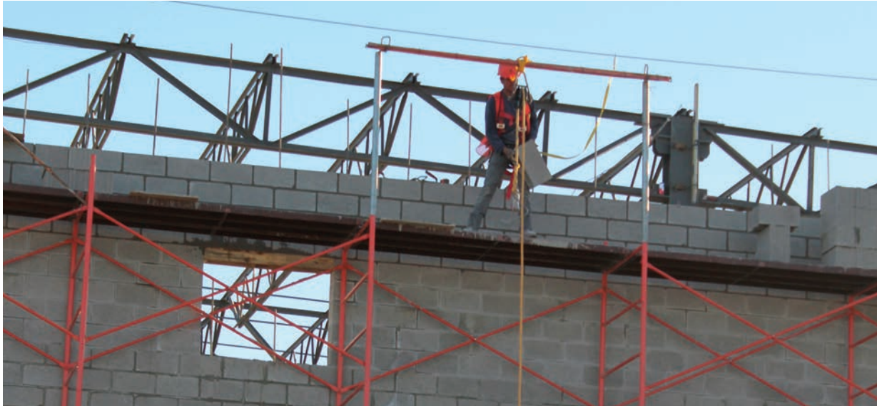
El trabajo en la construcción es una de las áreas en las que se emplea a menores de edad.