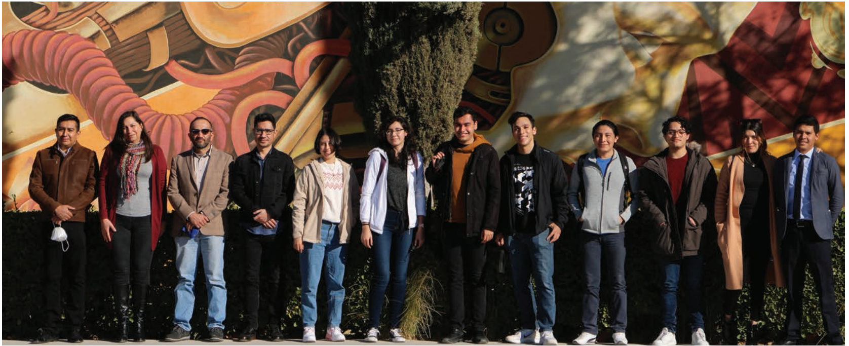
Alumnos y docentes que fueron motivo del reconocimiento.