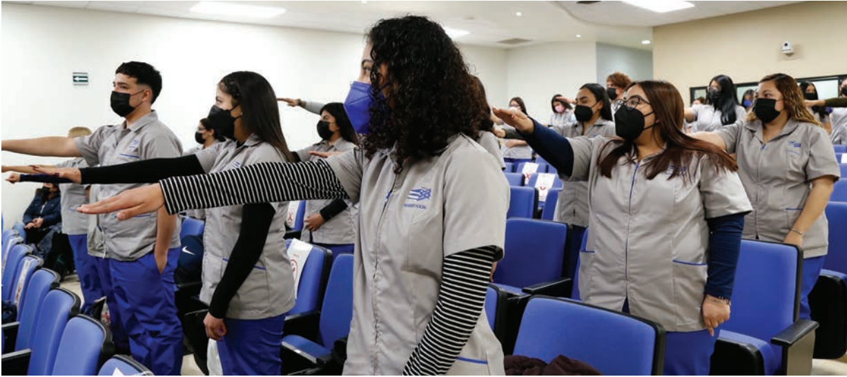
Alumnas de Trabajo Social rinden protesta en una ceremonia celebrada en el ICESA.