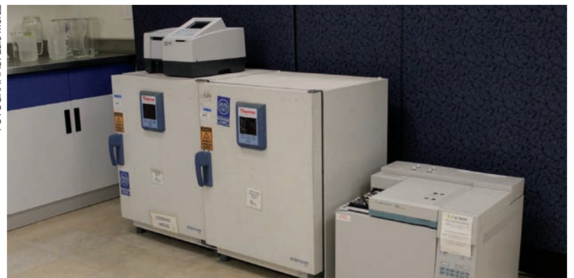
Equipo donado por la empresa Johnson & Johnson.