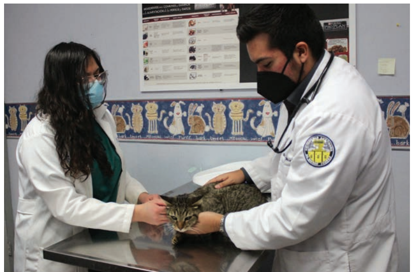
Un ejemplar felino en una consulta en la Clínica de Perros y Gatos.

Para obtener la muestra con la que se efectuará esta herramienta, se lleva a cabo un procedimiento no doloroso e invasivo para la mayoría de las mascotas, que se consigue por medio de un hisopo largo, y de buen