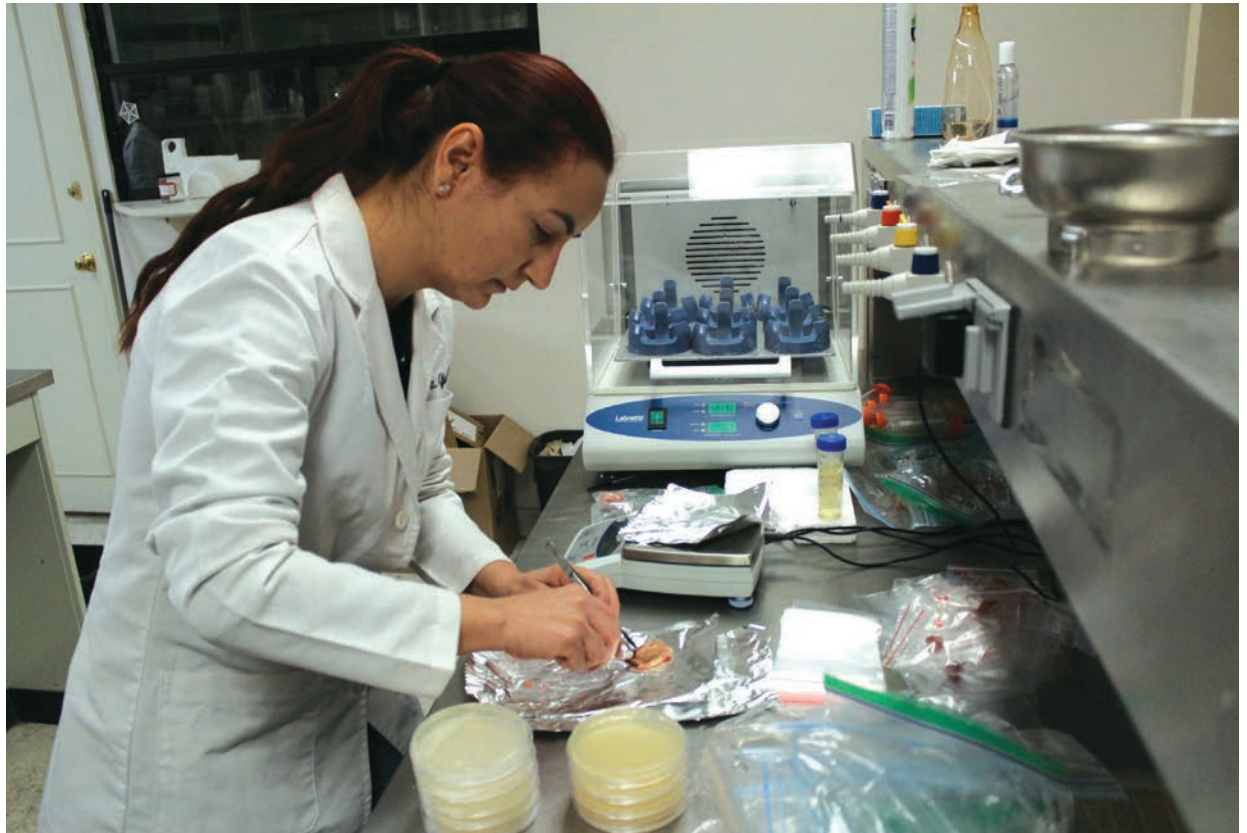
La doctora en Ciencias Jurídica Ortiz Rivera durante su trabajo en laboratorio del ICB.