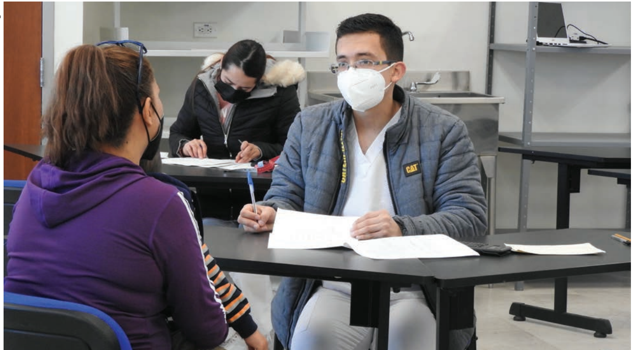
Una mujer y su pequeño hijo son atendidos por un alumno del Programa de Nutrición