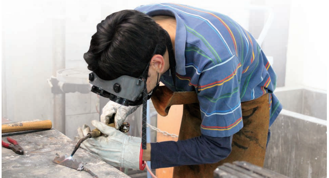
Un adolescente realiza trabajo de soldadura en un taller.

En el estudio se definieron seis dimensiones con las que se puede determinar si los menores se encuentran realizando un trabajo peligroso, que son: horario laboral, problemas de salud física, lugar de trabajo, carga de cosas pesadas, problemas de salud mental y peligros en el lugar de trabajo.