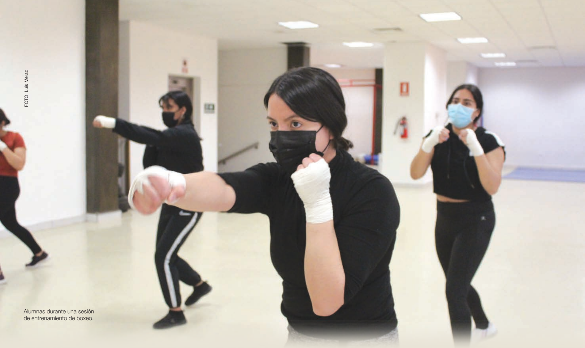
Alumnas durante una sesión de entrenamiento de boxeo.