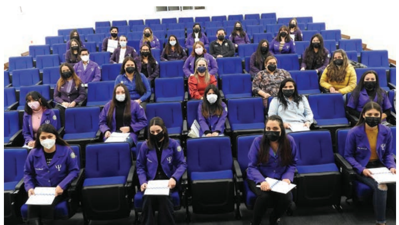
Alumnos en el auditorio Hidalgo donde se celebró la ceremonia de toma de protesta.