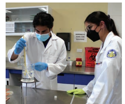
En laboratorios de Bioquímica y Microbiología serán utilizados los materiales donados.