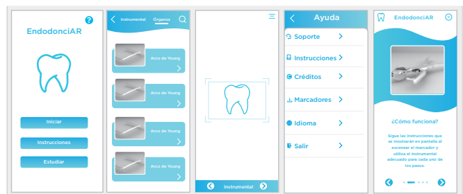
Figura 5. Algunas de las páginas de la interfaz de la aplicación en RA [20] .

Para desarrollarlo, el autor utilizó la metodología de diseño y desarrollo de cascada. Este ciclo de vida de software utiliza un proceso de etapas con un orden específico, lo cual hace ver que el estudiante visualiza el proyecto como una actividad compleja y que necesita de una estructura definida que lo guíe a lo largo del trabajo. Sin embargo, en las etapas que menciona no se identifican las de diseño de interacción o un proceso que lo guíe para experimentar la usabilidad de su aplicación de realidad aumentada.