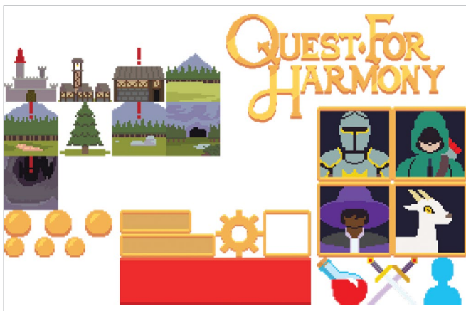
Figura 4. Presentación del logotipo y estilo del videojuego [19] .

El caso utiliza una metodología de desarrollo de videojuegos, en la cual se enlistan las etapas y pasos que se realizan en cada sección. La metodología, que se estructura en inicio, preproducción, producción, pruebas y beta, explica la forma en que se realiza el videojuego, pero no menciona la manera de desarrollar la etapa del diseño de interfaz o diseño de interacción, cuyos elementos pueden enriquecer el proyecto presentado.