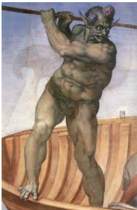
El Juicio Final , 1534-1541, Fresco, 1.370 x 1.220 cm. Capilla Sixtina, Ciudad del Vaticano, Roma

El tema de la muerte resulta manifiesto en tres de los únicos cuatro cuentos que publicó, por ejemplo, en “La pesadilla del mal sueño de lo desconocido (incidente con relación al hombre de