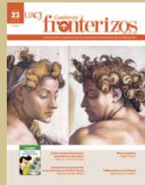
Bóveda de la Capilla Sixtina La embriaguez de Noé (Ignudis), 1508-1512, Roma, Vaticano

45 Caso Assange: un asunto pendiente de la globalización