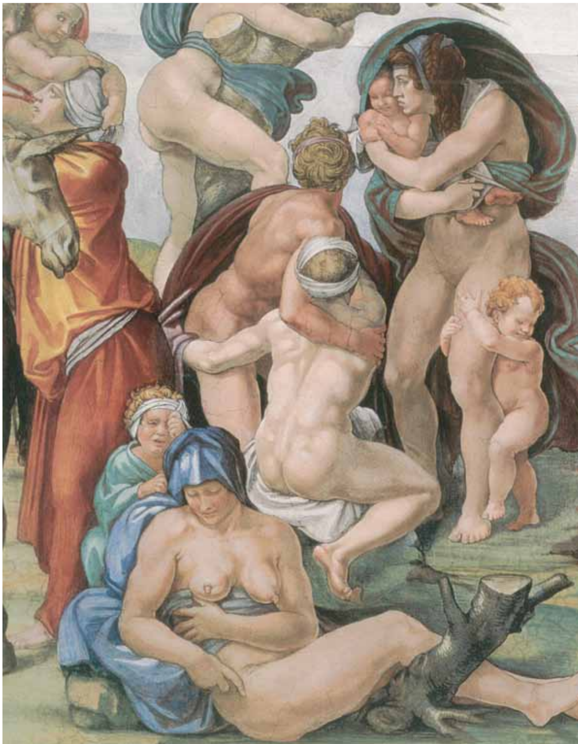
El Diluvio Universal , 1509, Fresco • Renacimiento 280 cm x 570 cm. Capilla Sixtina, Ciudad del Vaticano, Roma