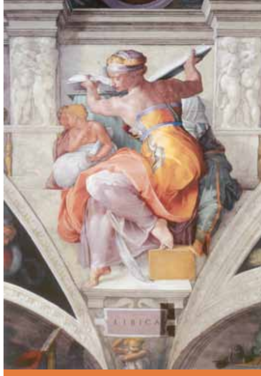
Bóveda de la Capilla Sixtina ( Sibila Libia ), 1508-1512, Vaticano, Roma

Casas, porque no quiero adular a mis nacionales ni tampoco calumniarlos”. 4 Más adelante, en beneficio de la honestidad de Hernán Cortés, indica que en sus Cartas de Relación “...no alaba sus propios hechos ni oscurece los de otros. Si él hubiera tenido el atrevimiento en engañar a su rey, sus enemigos, que tantas quejas presentaron contra