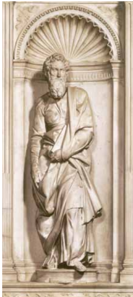
San Pablo, 1501-1504, Mármol, altura 127cm, Siena, Catedral, altar Piccolomini

Posiblemente habrá quienes al leer lo que hemos estado expresando hasta este momento, argumenten que me desvié del tema que supuestamente pretendía plantear y que como lo señalan algunos estudiosos sobre temas de Educación indican: "... que partir de esquemas teóricos que suponen realidades sociales, ponen en riesgo una invalidación de la educación de la que se pretenda dar..."; ante dicha preocupación me permitiría rebatir, interpretando a Ernesto Sabato: ¿qué no es más indigno implementar procesos educativos "que fundamenten la vida en la idolatría de la técnica y la explotación del hombre?, donde para la obtención del dinero sean válidos todos los medios [...] es innegable que esta sociedad ha crecido llevando como meta la