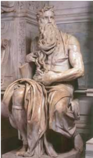
Moisés, 1513-1515, Mármol, San Pietro in Vincoli, Roma