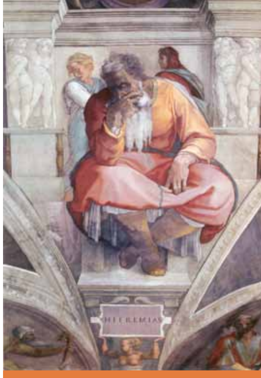
Bóveda de la Capilla Sixtina ( El Profeta Jeremías ), 1508-1512, Vaticano, Roma

En el caso de Cortés, es relevante reconocer su proclividad a identificarse y apropiarse, en sentido real y emocional, de la tierra recién conquistada, con todas las consecuencias que ello trae aparejado cuando se habla de la más temprana conciencia criolla. El valor estratégico que Cortés otorgó al territorio mexicano como