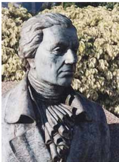
Francisco Xavier Balmis

Balmis, nacido en 1753 en Alicante, había pasado un tiempo como botánico en la Nueva España y tenía intenciones de regresar, estaba familiarizado con los avances sobre la vacuna y había traducido al español el Tratado práctico de la vacunación de Moreau de la Sarthe, así que sometió a consideración de la junta real de médicos una estrategia a partir de la inoculación “brazo a brazo” en la que un ser vivo es portador del fluido vacunal, el cual se extrae para depositarlo en otra persona. El nombre de “vacuna” procede de la observación del médico Edward Jenner, quien observó en 1796 que las muchachas que trabajaban en las granjas ordeñando vacas que habían padecido una enfermedad llamada vacuna (small pox) eran inmunes a la viruela.