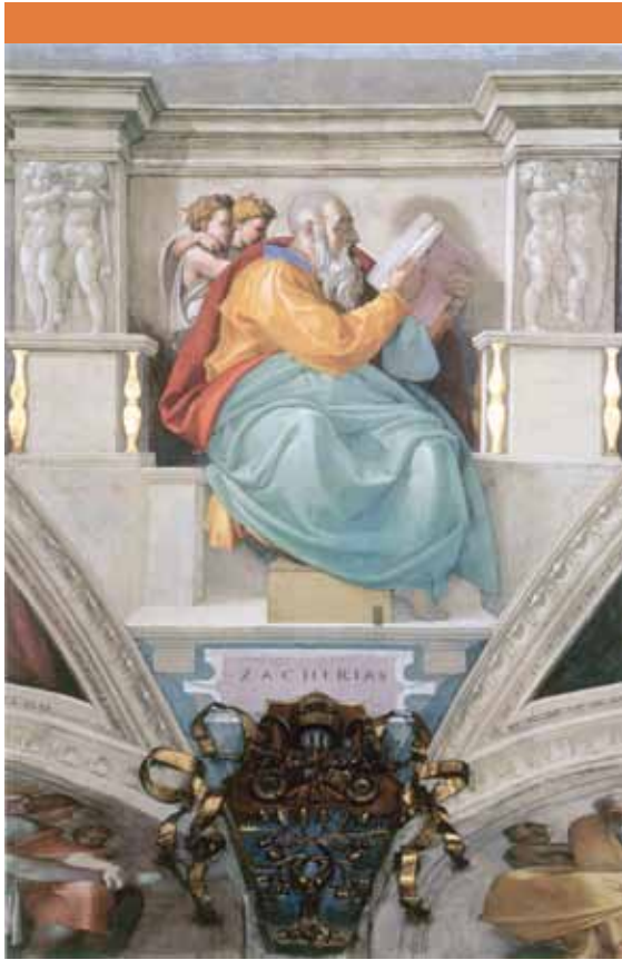
Bóveda de la Capilla Sixtina ( El Profeta Zacarías ), 1508-1512, Vaticano, Roma