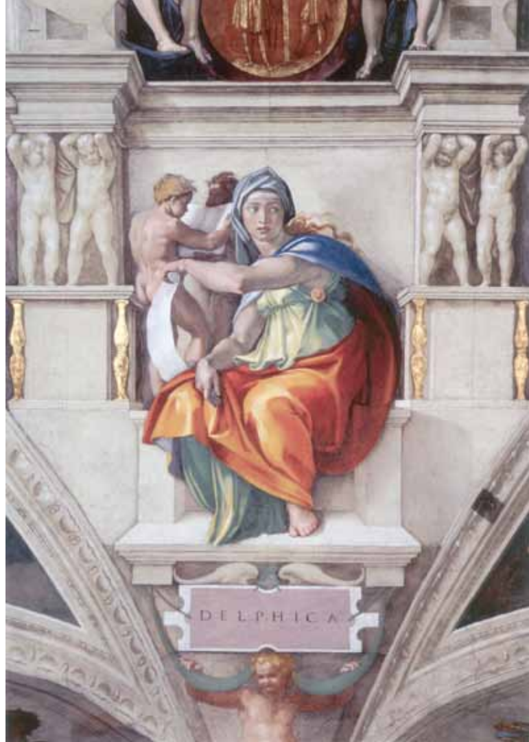
Bóveda de la Capilla Sixtina ( Sibila Delfica ), 1508-1512, Vaticano, Roma

En esa convivencia cotidiana se fortalecerá o