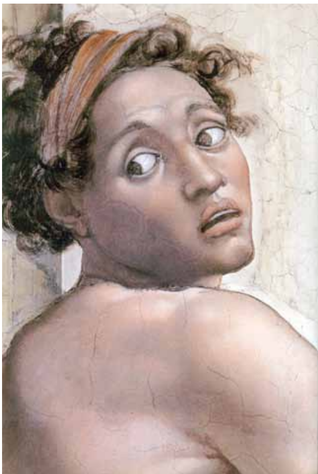
Bóveda de la Capilla Sixtina, El sacrificio de Noé (ignudi), 1508-1512, Vaticano, Roma