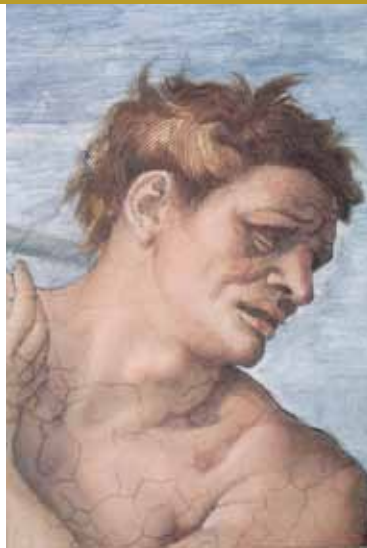
Caída del Hombre, pecado original y expulsión del Paraíso , 1509, Fresco • Renacimiento, 280 cm x 570 cm. Capilla Sixtina, Vaticano

Igualmente han entrado en la discusión sobre