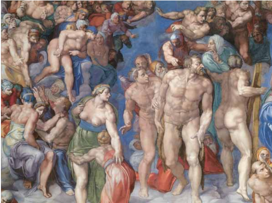
El Juicio Final , 1534-1541, Fresco, 1.370 x 1.220 cm. Capilla Sixtina, Ciudad del Vaticano, Roma