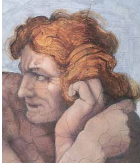
Caída del Hombre, pecado original y expulsión del Paraíso, 1509, Fresco • Renacimiento, 280 cm x 570 cm. Capilla Sixtina, Vaticano

Todo suena muy bien, pero resulta que otros líderes europeos, los de la década de los años 90, también llegaron al mismo acuerdo, limitar su grado de endeudamiento al 3%, en el año de 1997, justo en el momento que se estaba formalizando el acuerdo de creación de la Unión Europea. En aquel año se declaró vigente el "Pacto por la estabilidad y el crecimiento" cuyo principal defensor era el ministro de finanzas alemán Theodor Waigel.