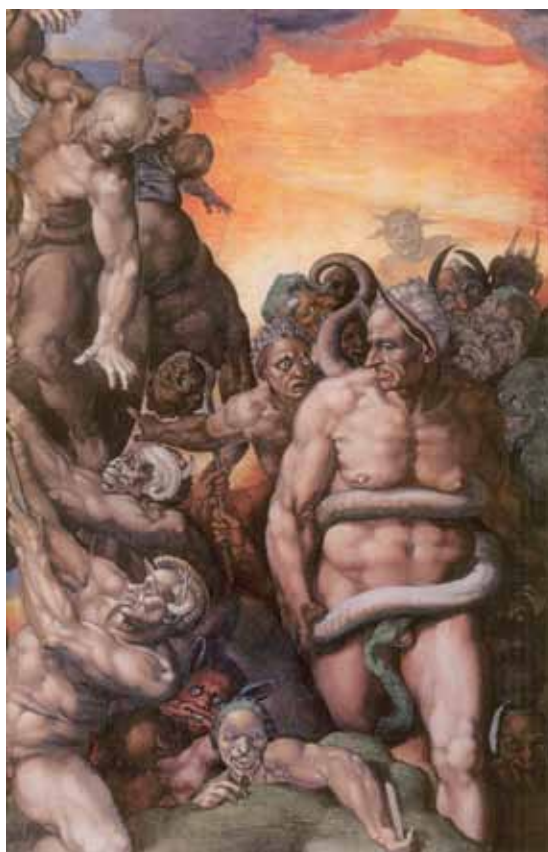
El Juicio Final , 1534-1541, Fresco, 1.370 x 1.220 cm. Capilla Sixtina, Ciudad del Vaticano, Roma