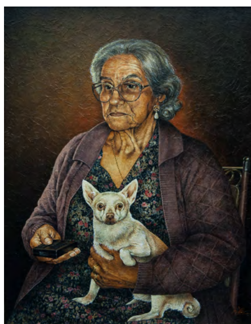
Antonio Castro. "Me vale madre (mamã)", 1998.