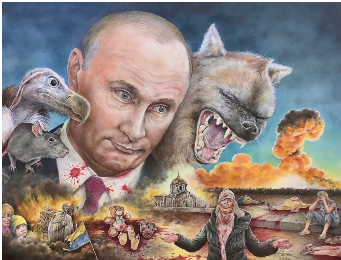
Antonio Castro. "Bestias", 2022.