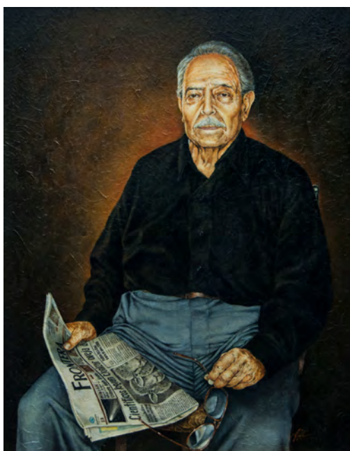
Antonio Castro. "Preocupado (papá)", 1998.