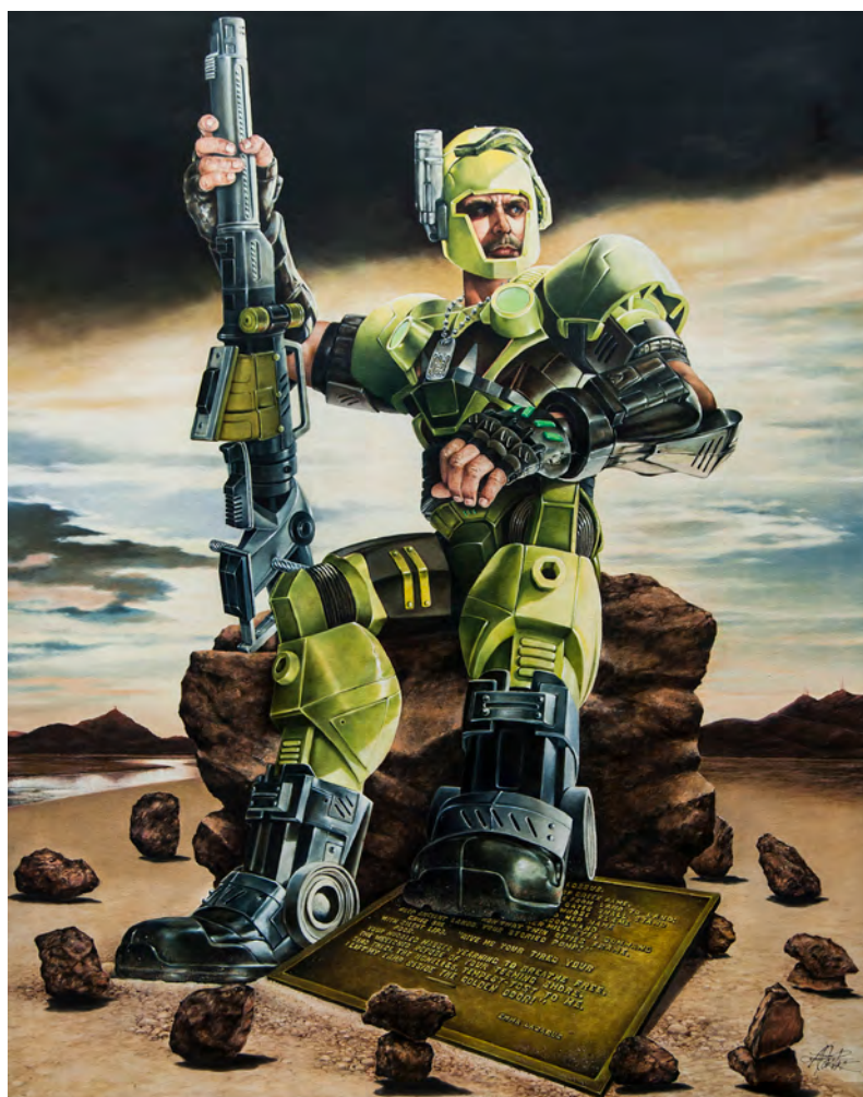
Antonio Castro. “El nuevo Coloso”, 2011.