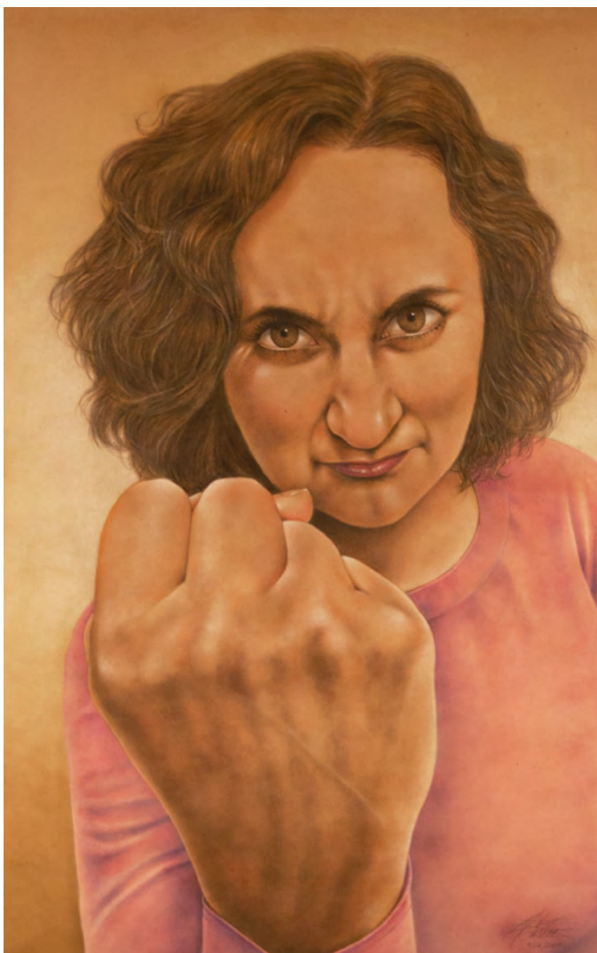
Antonio Castro. "Nutcracker", 2017.