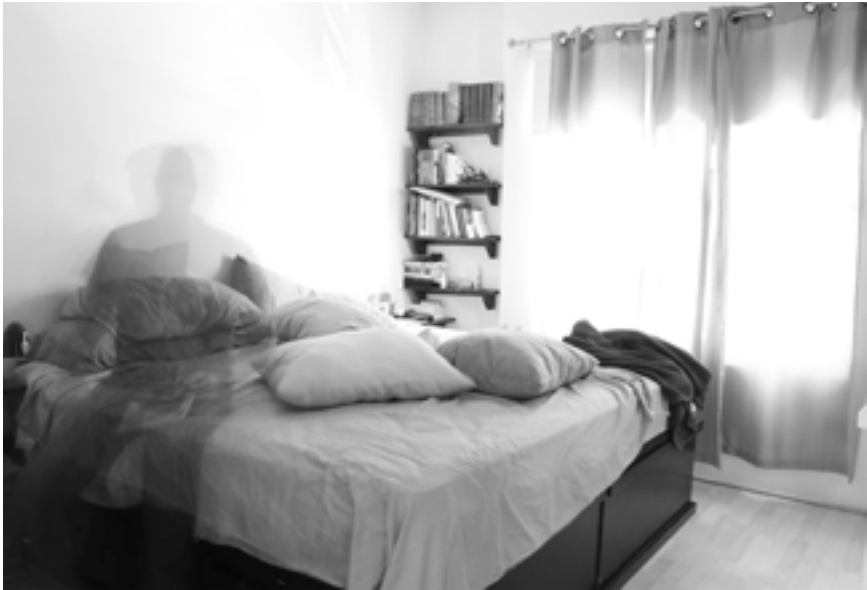
Ensayo fotográfico: "Ecos del hogar", Brenda Cenicerros, 2018.

Pero ¿qué paso?, de un día al otro esos límites se volvieron difusos, corredizos, transparentes, los espacios se yuxtapusieron, y se articularon como un entes infinitos e indefinidos.