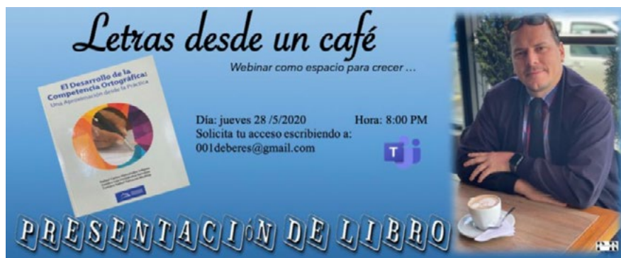
Figura 2. Ejemplo de una de las invitaciones del espacio: ¡Letras desde un café!