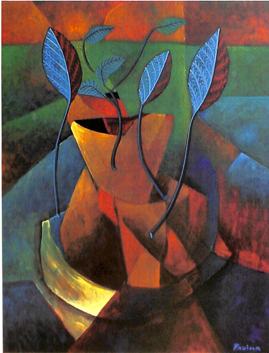
Hojas. Acrílico sobre madera, 55 x 42 cm.