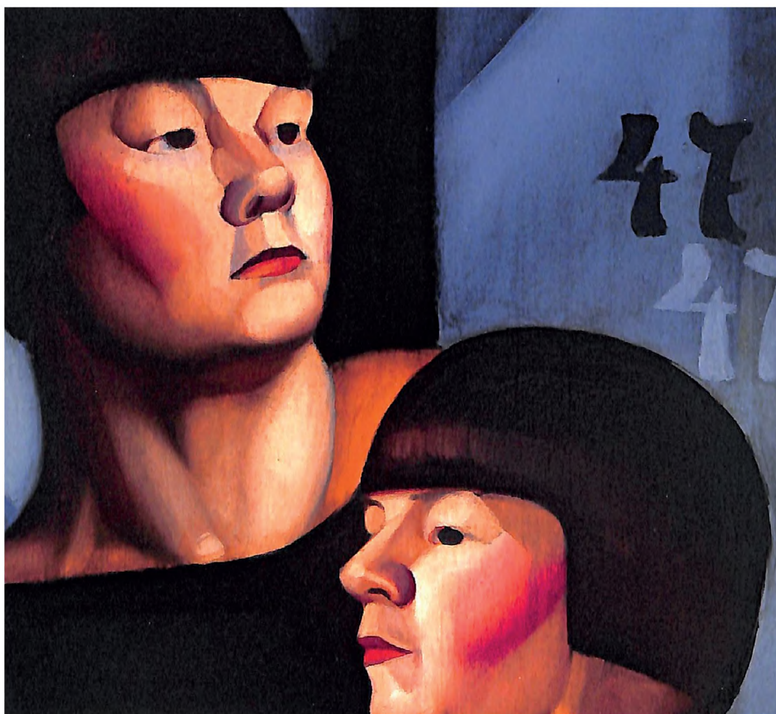
El doble 47 (detalle), ca. 1924