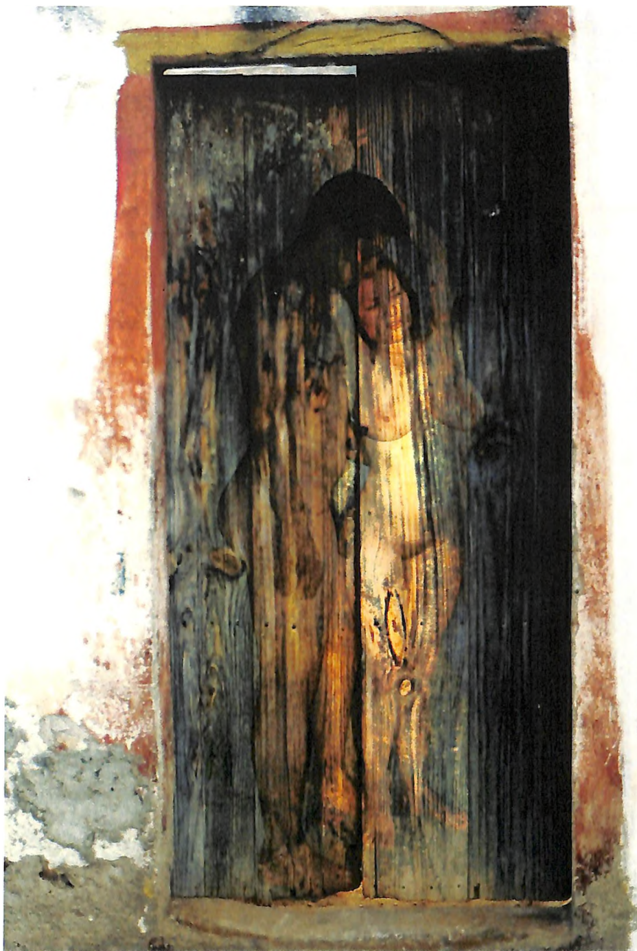
Amantes II, Fotomontaje.