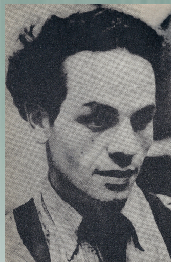
Nicanor Parra. Estudiante en el Instituto Pedagógico. Chile aprox. 1930.

Del libro: Obra gruesa . Editorial Universitaria, Santiago de Chile, 1969.