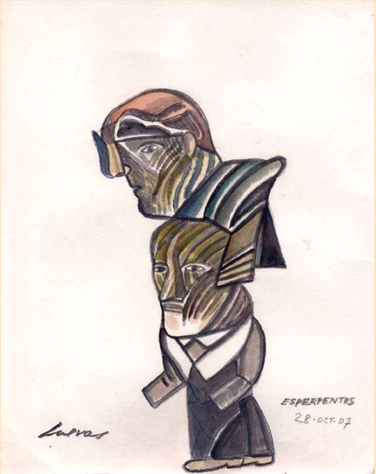
Esperpentos , 28.oct.07, Mixta sobre papel 38 x 30 cm. / José Luis Cuevas