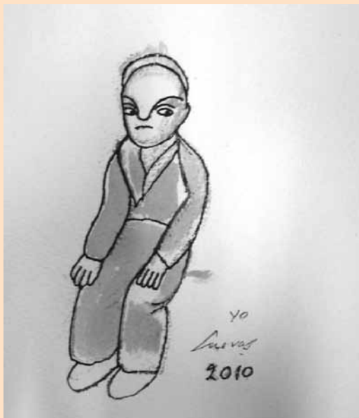
Yo, 2010, Tinta y aguada de tinta sobre papel 19 x 14 cm. / José Luis Cuevas

José Luis Cuevas (México, 1934), es uno de los artistas de la plástica mexicana del siglo XX más destacados. Su amplia trayectoria se inicia a muy temprana edad, cuando siendo aún muy joven, despertó el interés y admiración no sólo en su país natal, sino en Estados Unidos y en el continente europeo. Durante una de sus primeras exposiciones en España, Picasso reconoció el talento de aquel joven artista mexicano de 24 años, y adquirió algunas de las piezas expuestas.