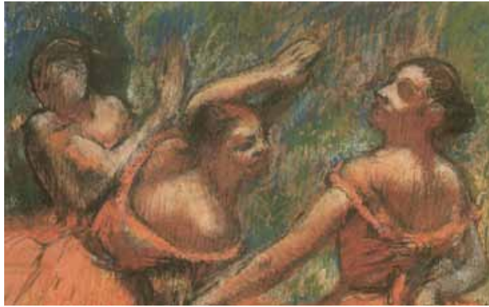
Red Ballet Skirts, c. 1897-1901 / Degas (detalle)

nios plurales como una medida de presión para ponerle un alto a la poligamia y evitar su propagación. Esta acción tampoco incide en la detención de sus prácticas, sino que motiva la clandestinidad de sus costumbres y creencias en los años posteriores.