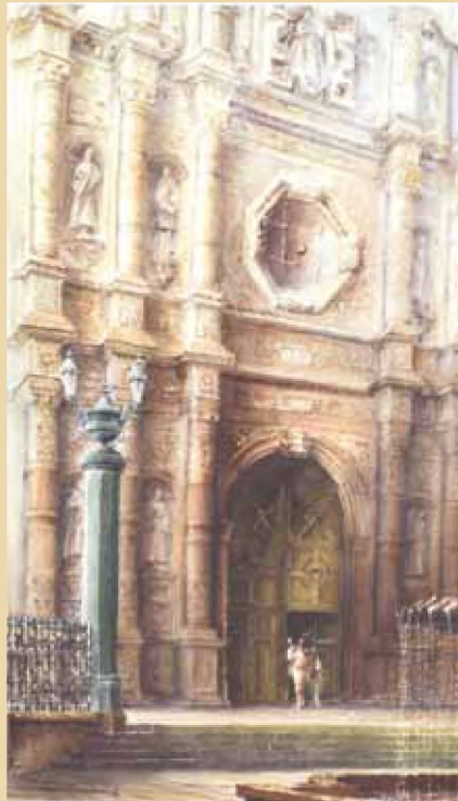
Catedral de Chihuahua (detalle) / Chihuahua

Como podemos ver, la crisis generada en la autonomía de las universidades públicas por el modelo neoliberal ha contribuido a que ya no se vea a las instituciones de educación superior como "instrumentos de socialización ideológica". 8 Esta crisis ha ayudado a imponer el individualismo y el utilitarismo como guía de acción de los universitarios. 9