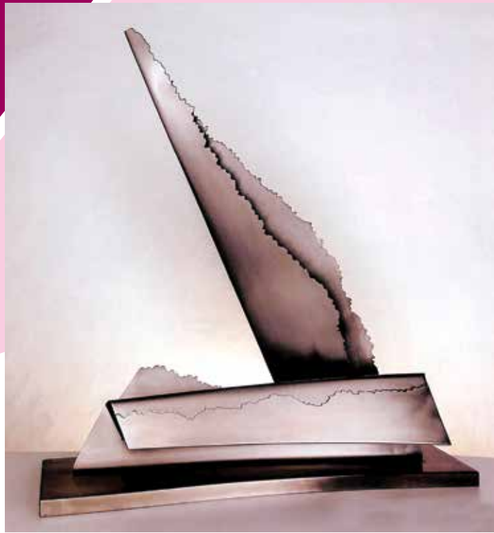
Aire de parecerse, Acero inoxidable, 2009-2019, 120 x 100 x 20 cm.

nes y él no podía tolerar que lo tratara como si fuera un pendejete. “Ándale, qué esperas...”, dijo enfática. Fer temblaba mucho por la cruda, aunque sabía perfectamente que aún estaba ebrio. “Deja me quedo a dormir, Ika. Me siento mal, muy mal”, susurró. “¡No, no, no...! ¡Lárgate! No tienes nada qué hacer aquí. No somos nada. ¡¿Entendiste?! Es más, nunca debí haber dejado que te quedaras. Fue un error”, dijo mientras agarraba de malas su bolsa. Scotty no paraba de ladrar. “Te juro que cuando regreses me voy. Dame chance de quedarme, por lo que más quieras. No he comido, necesito bañarme. Por favor, Ika”, terminó su retahíla de súplicas. Erika lo miró desconfiada, sopesó lo que podía hacer y, al final, después de respirar hondo, terminó asintiendo. “Está bien... Quédate un rato más, pero no quiero que hagas ninguna tontería y mucho menos que te metas con Scotty. ¿De acuerdo?”, dijo mirándolo fijamente. Fer levantó el brazo derecho y asintió: “Palabra de indio, Ika”. A Erika le molestó que Fer la siguiera llamado como cuando eran novios y ella lo adoraba... no, no lo adoraba, lo veneraba, pero no se pondría a discutir con él sobre eso cuando estaban a punto de enterrar a su tío, así que agarró las llaves de la casa, las del coche y salió casi corriendo. Fer se recargó en el sillón, respiró profundamente y agarró su garrafa de mezcal que estaba bajo los cojines. Juró para sí que sólo sería un trago pequeño, para quitarse el malestar que tenía encima. Destapó la garrafa y