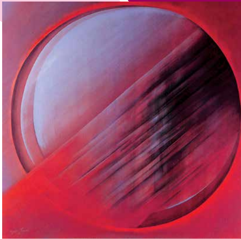
Sin título, Acrílico/tela, 2013, 180 x 180 cm.