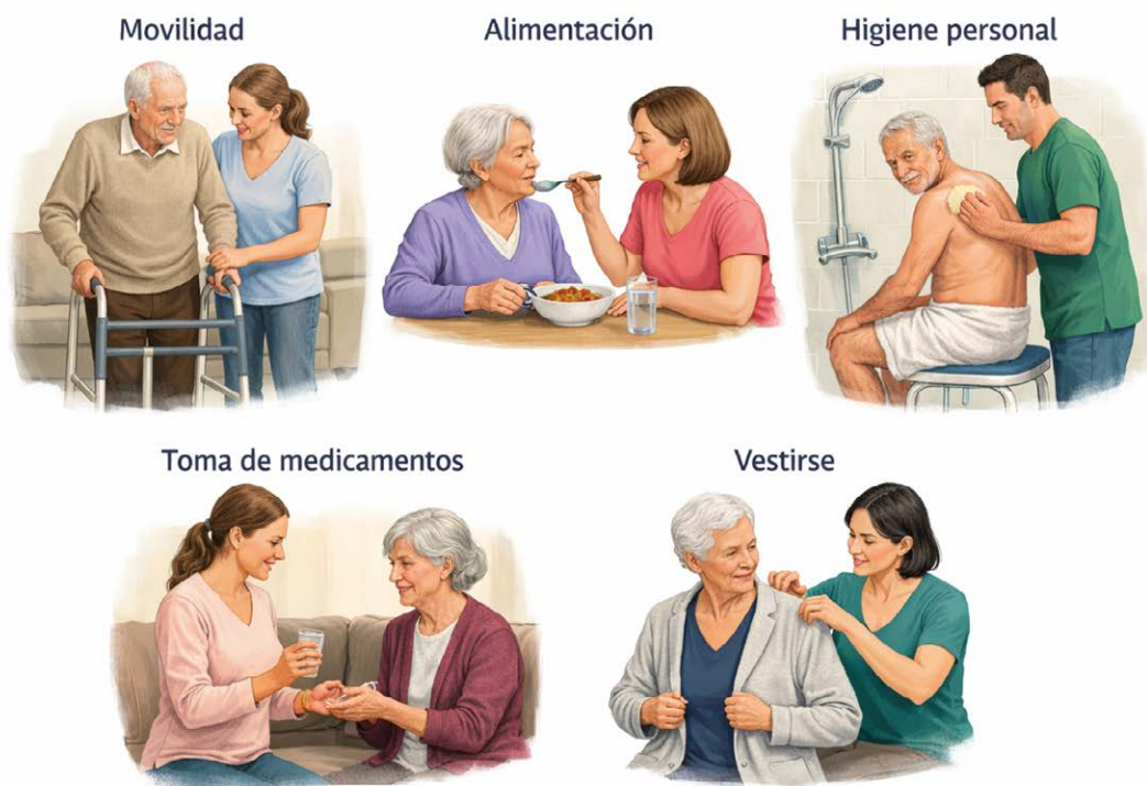
Figura 1. Actividades básicas de la vida diaria en las que una persona mayor con dependencia funcional puede requerir apoyo.

El envejecimiento de la población en México ha traído consigo un mayor número de personas mayores que presentan dependencia funcional , es decir, dificultad para realizar actividades básicas de la vida diaria sin ayuda. Se estima que para el año 2026, el 28.2 % de las personas mayores en México tendrá algún grado de dependencia leve o severa (Figura 1), lo que incrementará la necesidad de atención y cuidados de salud debido a su discapacidad o dependencia [1].