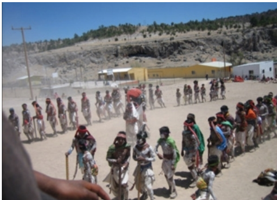
Figura 3. Danzantes fariseos de Naráachi, Semana Santa 2011.

Como ocurre en otras sociedades, entre los rarámuri un cuerpo incompleto no podría subsistir plenamente. El caso de un joven que conocí en el municipio de Carichí, Chihuahua, quien nació con un muñón al final de su brazo derecho, extremidad que esconde permanentemente bajo su ropa y quien siempre se aísla en